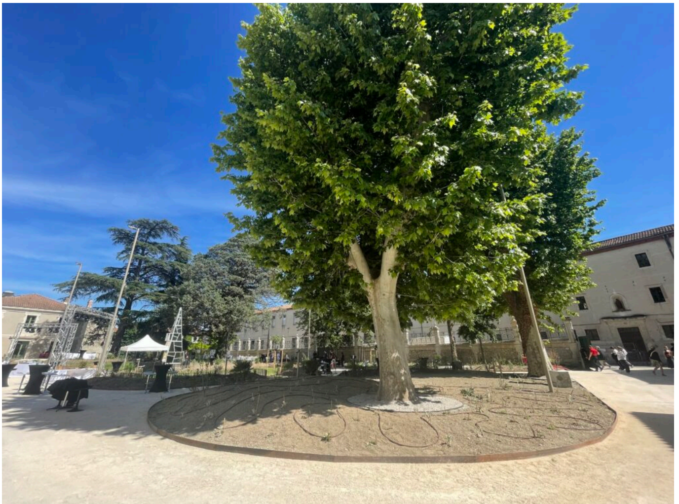
Partie des jardins de la Villa créative

Un dôme monumental, prévu pour septembre 2025 dans le jardin de la Villa Créative, incarnera cette vision d'une architecture durable et spirituelle, rétablissant le lien entre humains et écosystème. Côme Di Meglio développe, dans le cadre de S+T+ARTS, des architectures immersives en mycélium alliant design bioclimatique et contemplation. Favorisant bien-être et interactions sociales, le projet vise à réduire les coûts de fabrication pour diffuser largement ces structures grâce à une méthode innovante.