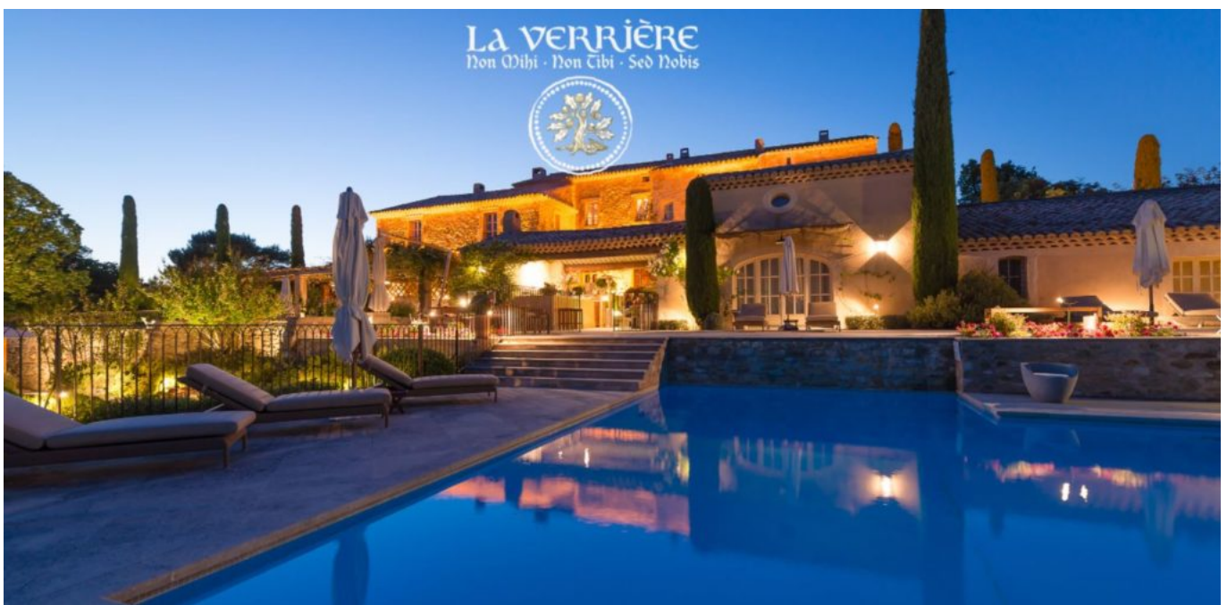
Le crépuscule des Dieux. @La Verrière

Sa posture de leader laisse une empreinte indélébile. Arrive la traditionnelle séance photo, il dirige, oriente la prise de vue. Mais il se résout très vite à adopter votre œil de photographe et vous laisse prendre la main. Ce qui vous marque ? Un verbe empreint de spiritualité et d'énergie positive. Le pont navigue entre les croyances ancrées du Moyen Âge, le taureau Vintur, Dieu du mal qui récolte les sacrifices humains (à l'origine du Mont Ventoux), la déesse Vaison et toute la symbolique de fertilité autour de la nature. Installé confortablement, son regard au loin se laisse transporter, animé d'une sagesse réconfortante. L'aura émanant de l'ancienne bastide du XVIII e est mystique.