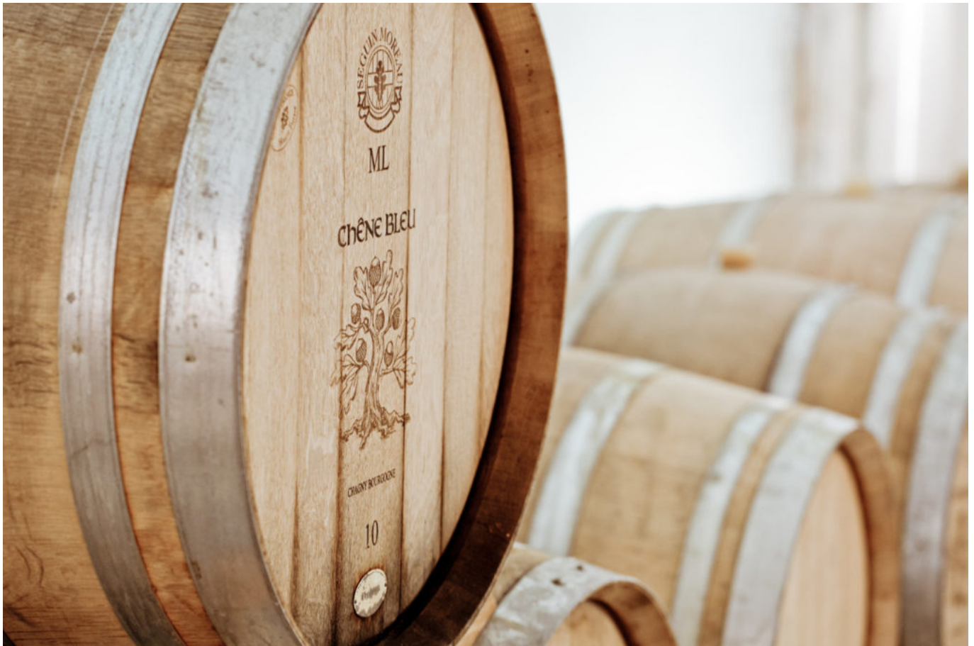
Le Chêne Bleu, toute une légende.

Ecrit par Linda Mansouri le 6 juillet 2021