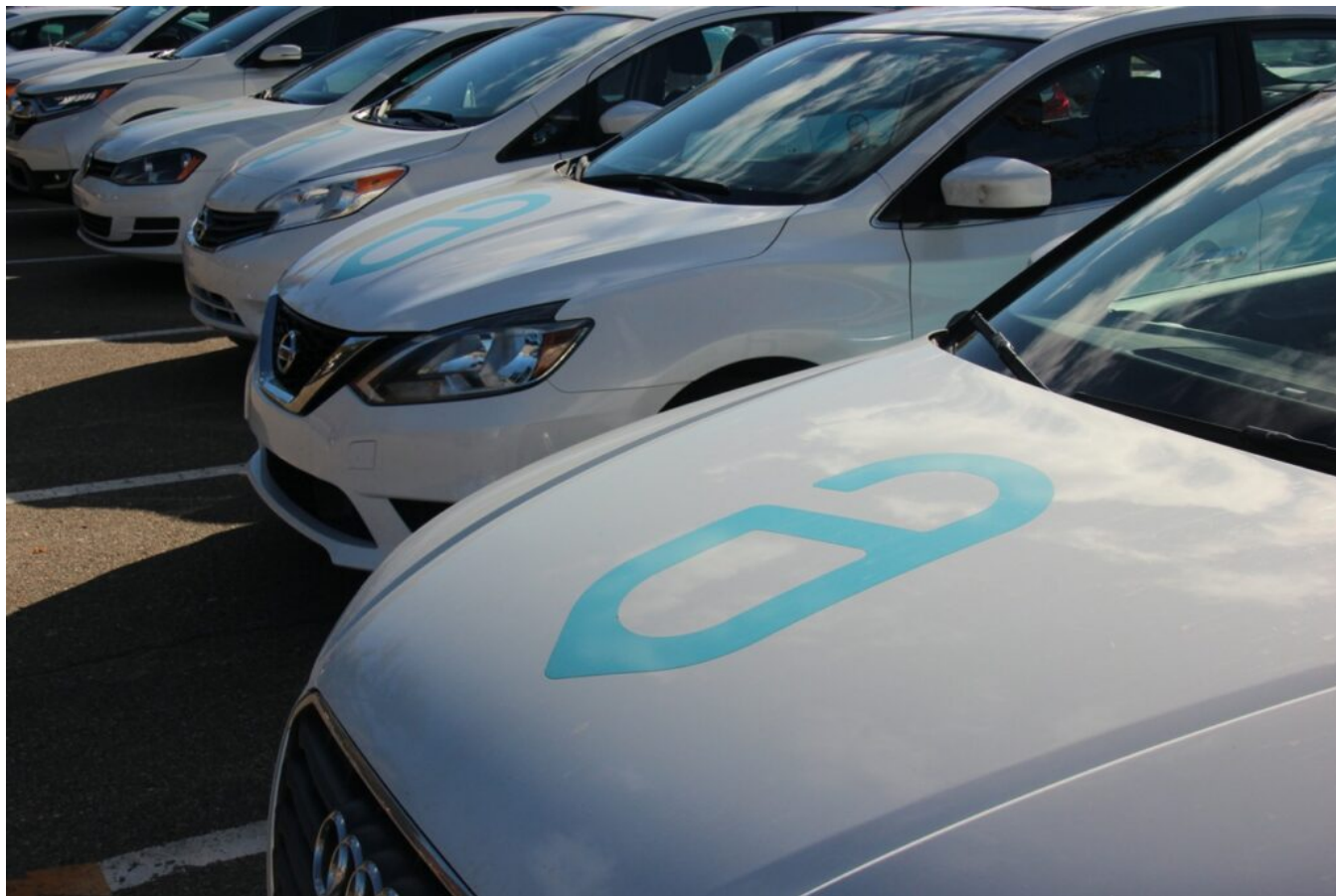
Véhicules floqués avec le logo de l'entreprise.

Ecrit par Vanessa Arnal-Laugier le 14 mars 2025