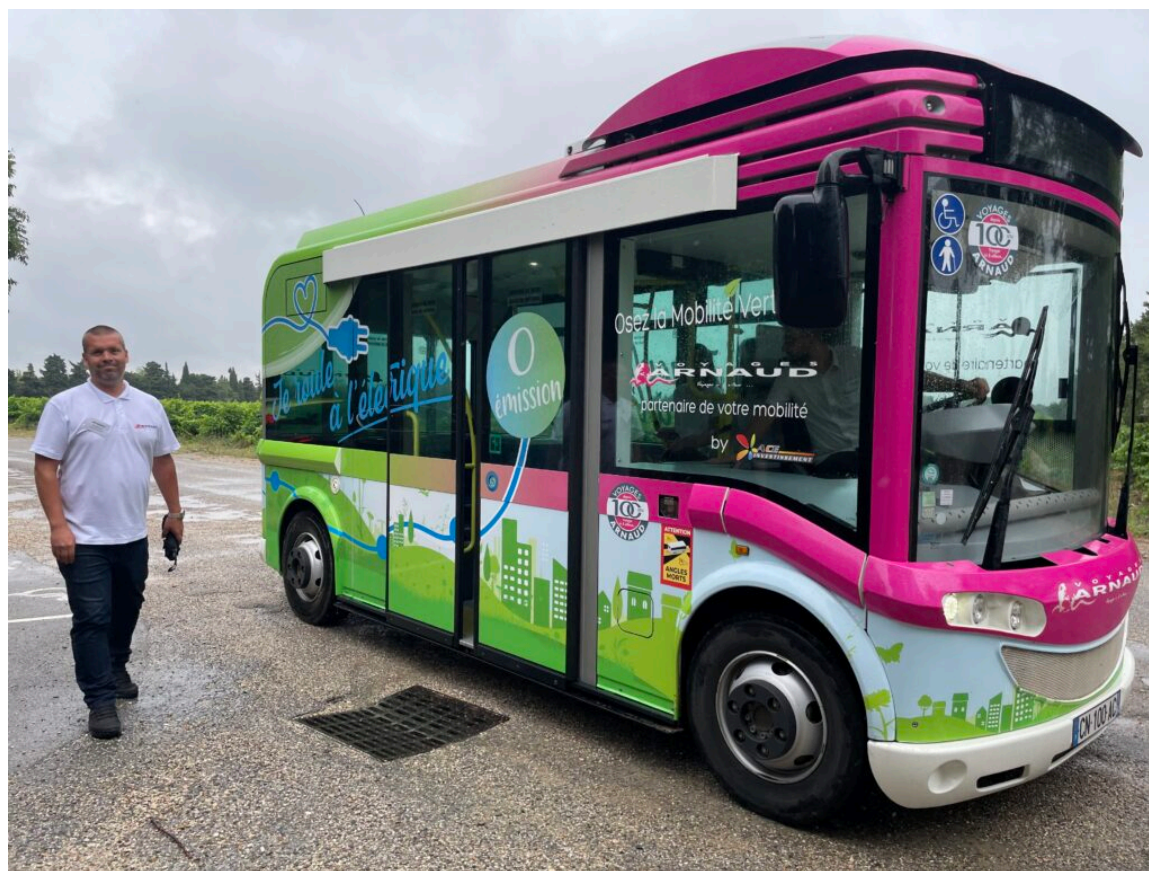
Navette électrique

Ecrit par Andrée Brunetti le 7 juillet 2023