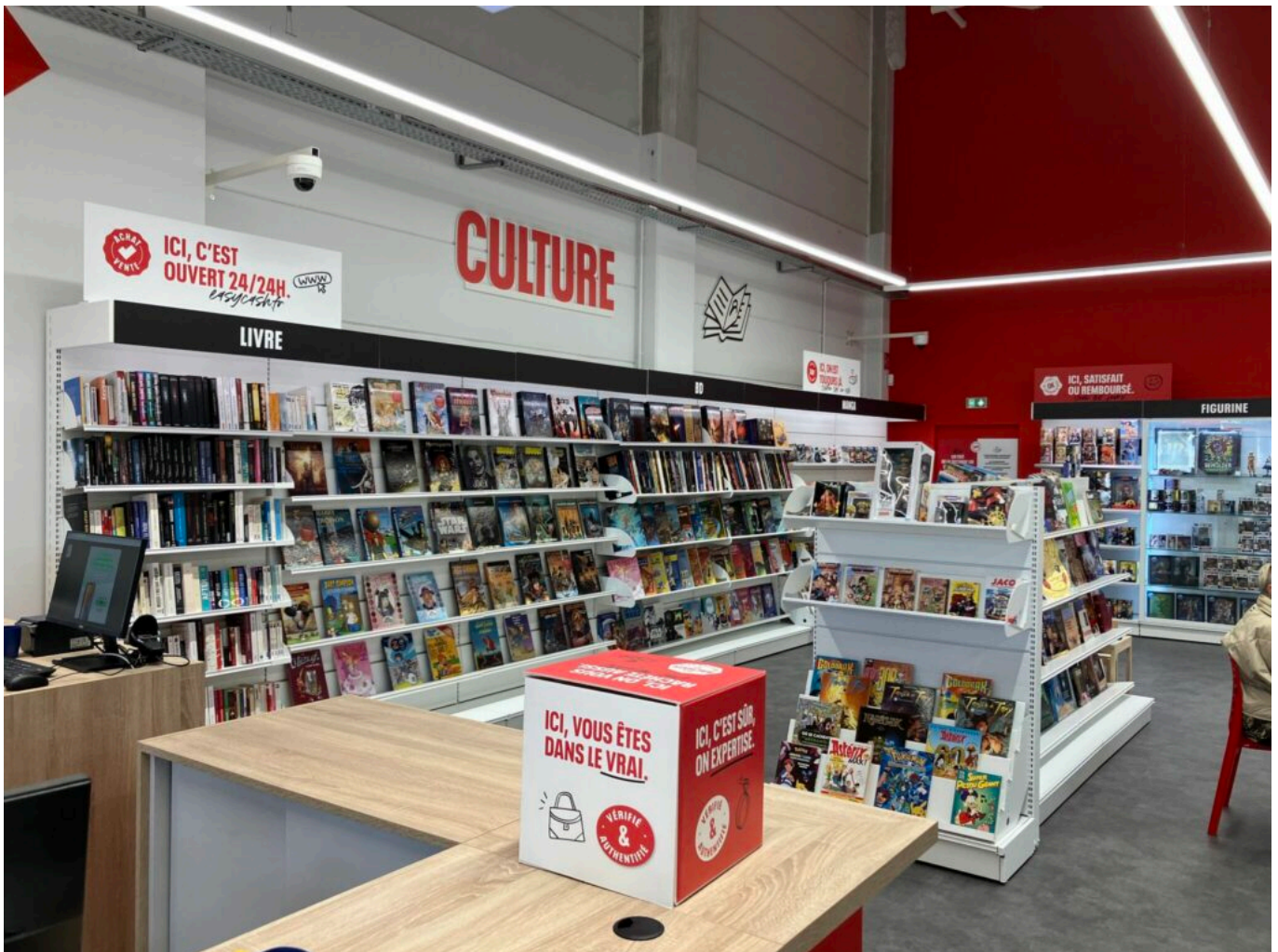
Le magasin d'Avignon.

Ecrit par Laurent Garcia le 23 novembre 2023