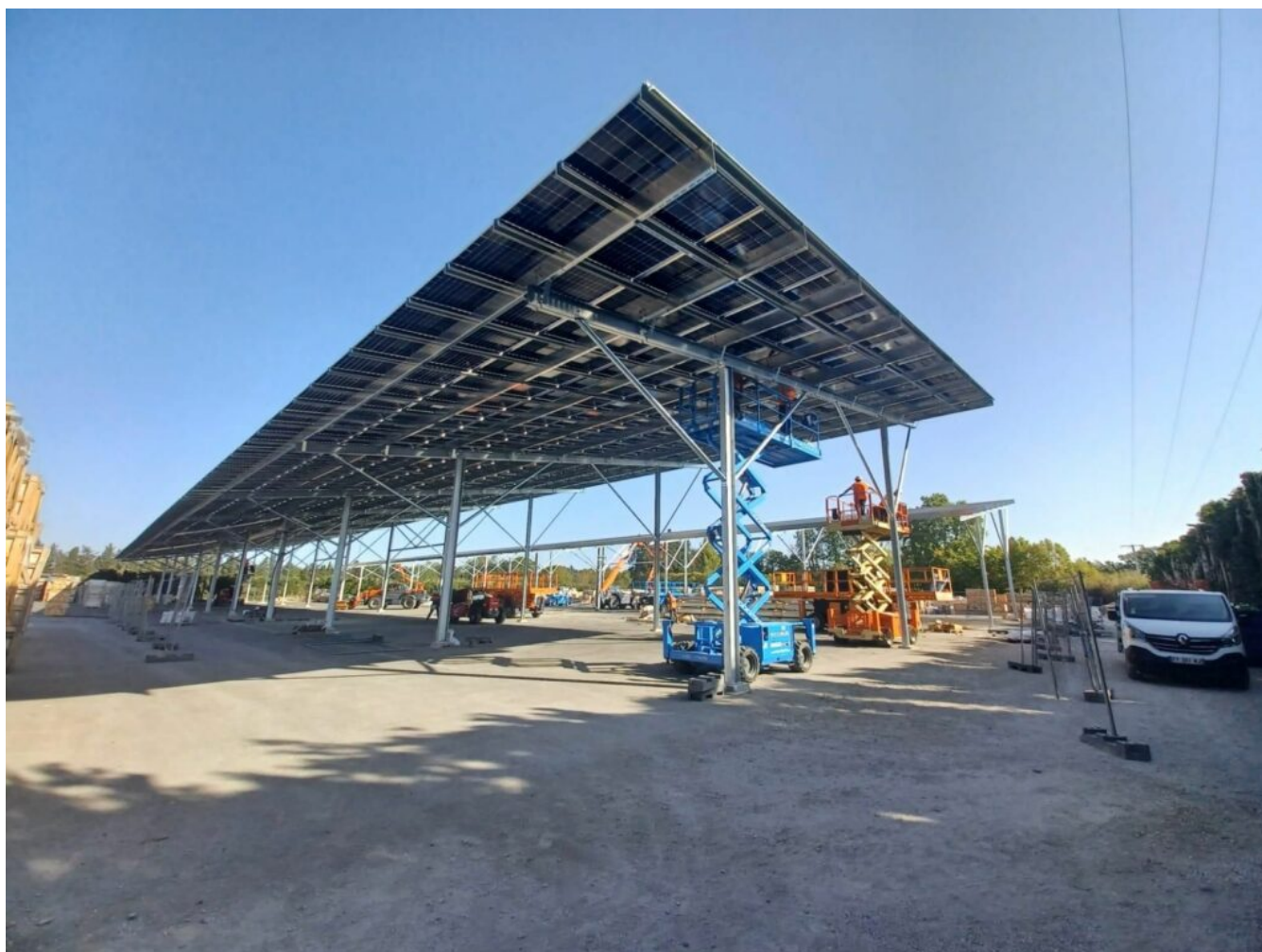
Chantier sur les zones de stockage de Natural Rock Distribution à Avignon.

Les développeurs territoriaux de Melvan essayent de déterminer les meilleurs endroits pour implanter les projets, tout en prenant en compte les nombreuses contraintes environnementales, topographiques, paysagères, sociales ou sociétales, mais aussi les contraintes de raccordement, de gisement, d'accès et d'urbanisme.