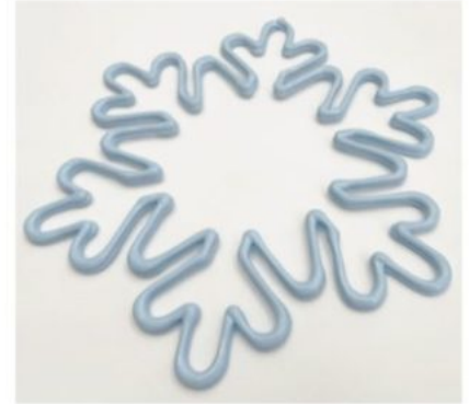
Un flocon de 80cm est composé de 8 bouteilles en plastique recyclé.