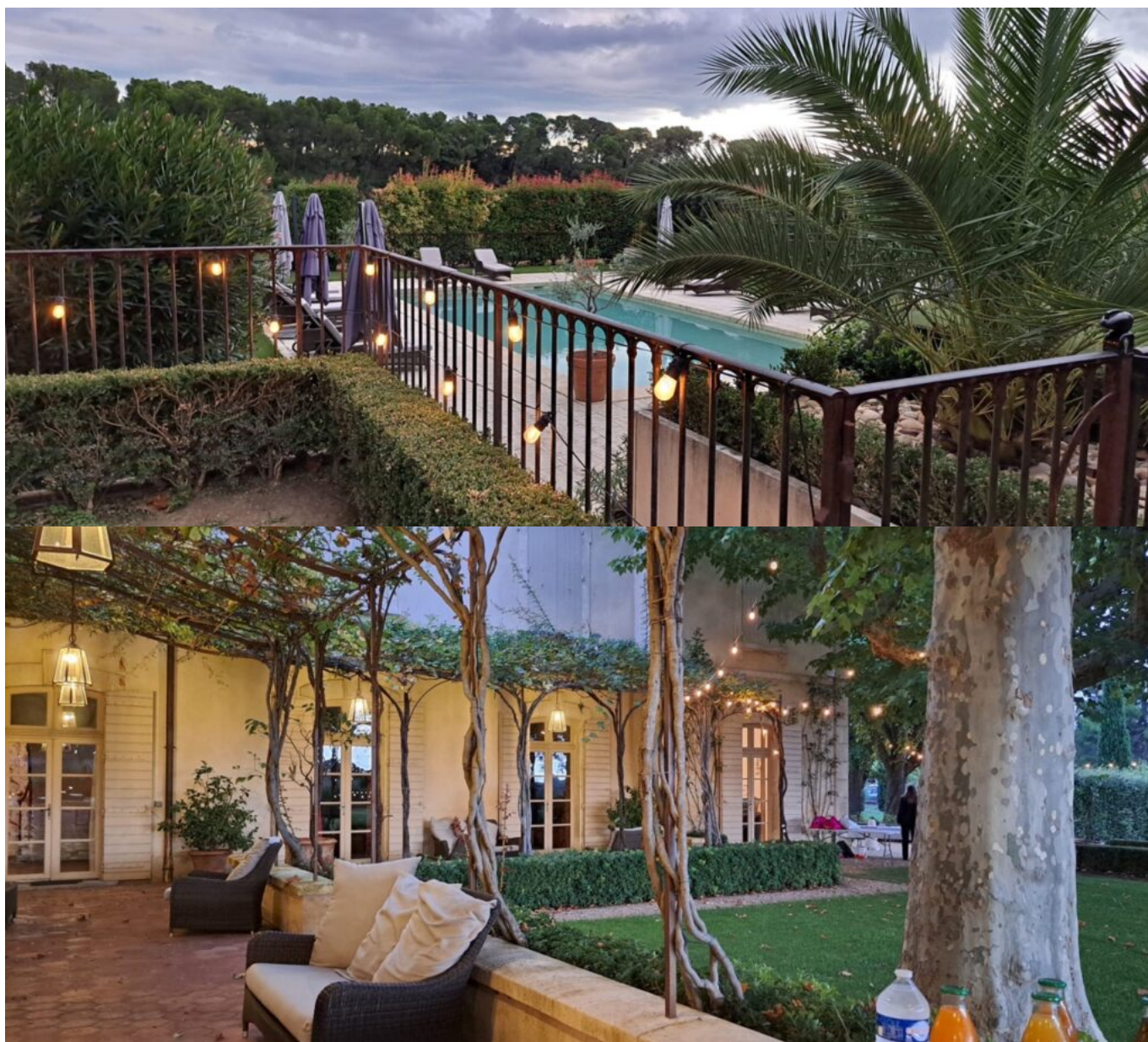
Le Château Gigognan, où s'est déroulée la soirée.

Ecrit par Andrée Brunetti le 2 octobre 2025