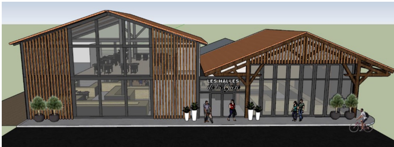
Maquette digitale de la devanture des Halles de la Gare.

Si la décoration et l'ambiance seront étudiées dans l'optique de faire de ces halles un lieu unique à Carpentras, les différents corners pourront être adaptés aux besoins et envies de leur exploitant, tout en restant en concordance avec le reste de l'espace. Les Halles de la Gare s'adapteront également aux envies des consommateurs. Elles proposeront donc des produits locaux, de qualité, et de saison, telle est le mode de consommation le plus privilégié depuis la pandémie de Covid-19.