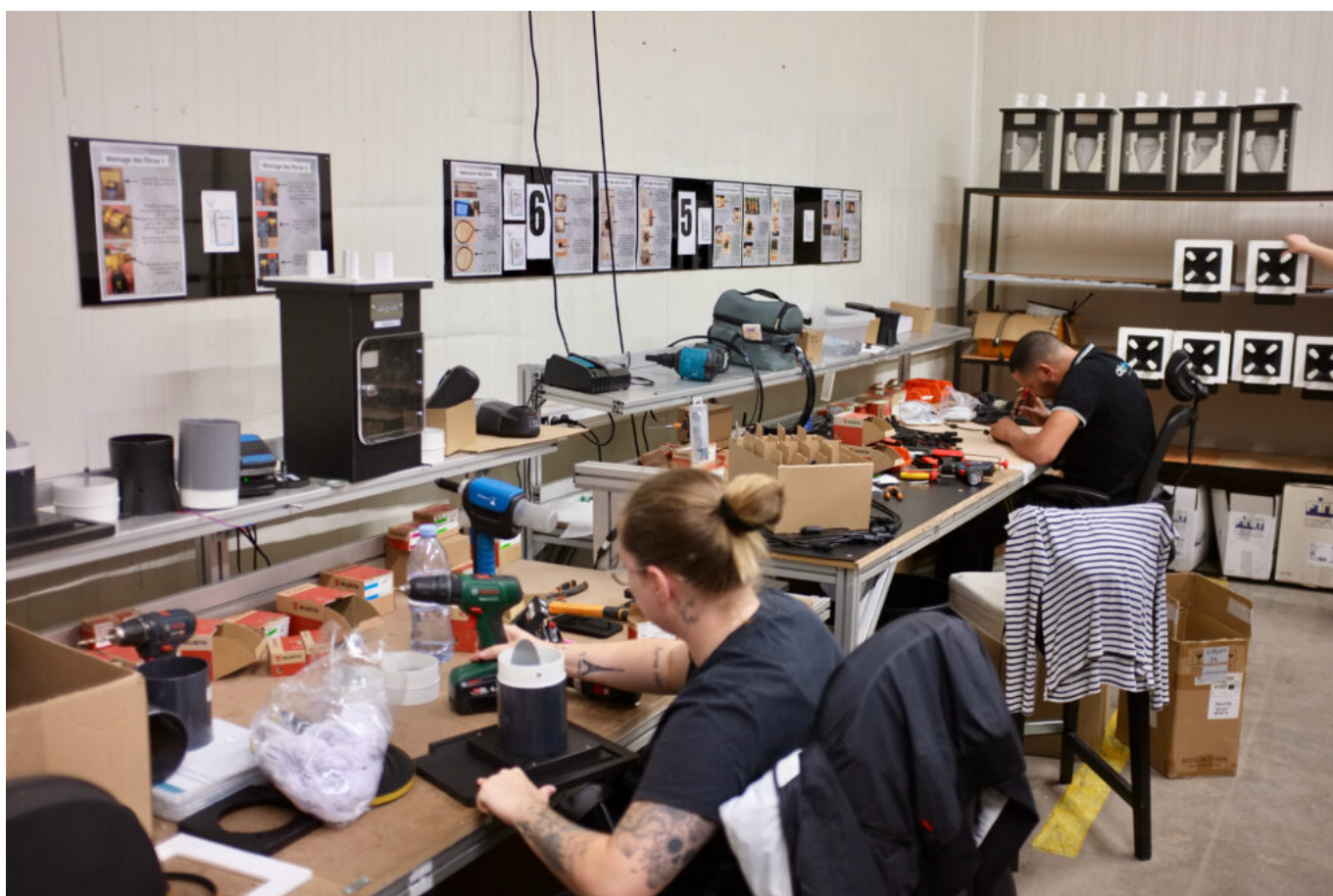
l'atelier d'assemblage