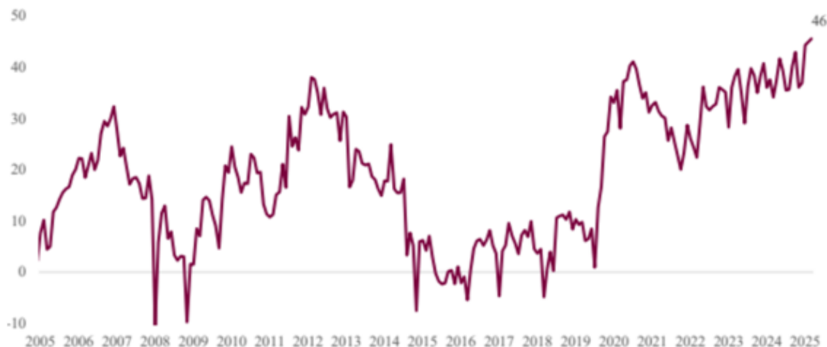
Solde d'opinion des ménages sur leur opportunité d'épargner Source : INSEE