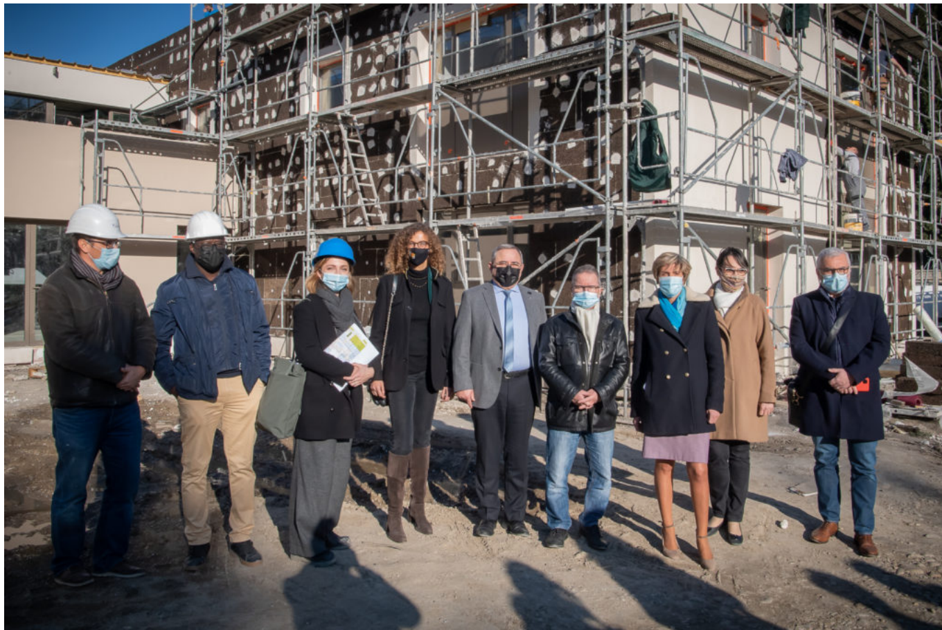
Visite de chantier.