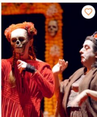
Les Bonnes ou la tragédie des confidentes

Près de 91% des professionnels accrédités sont français (soit 1 953) ; 27% d'entre eux proviennent de la région Île-de-France ; 22% de la Région Sud ; 14% de la région Auvergne-Rhône-Alpes et 10% de la région Occitanie. Et, surtout 75% de ces professionnels sont issus de structures subventionnées. De même une à 3 personnes sont employées par la même structure.