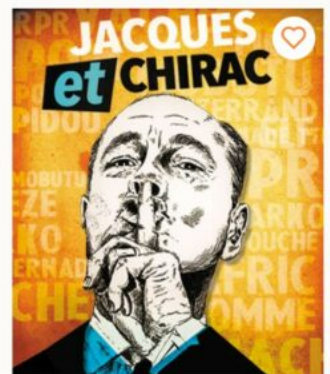
Jacques et Chirac