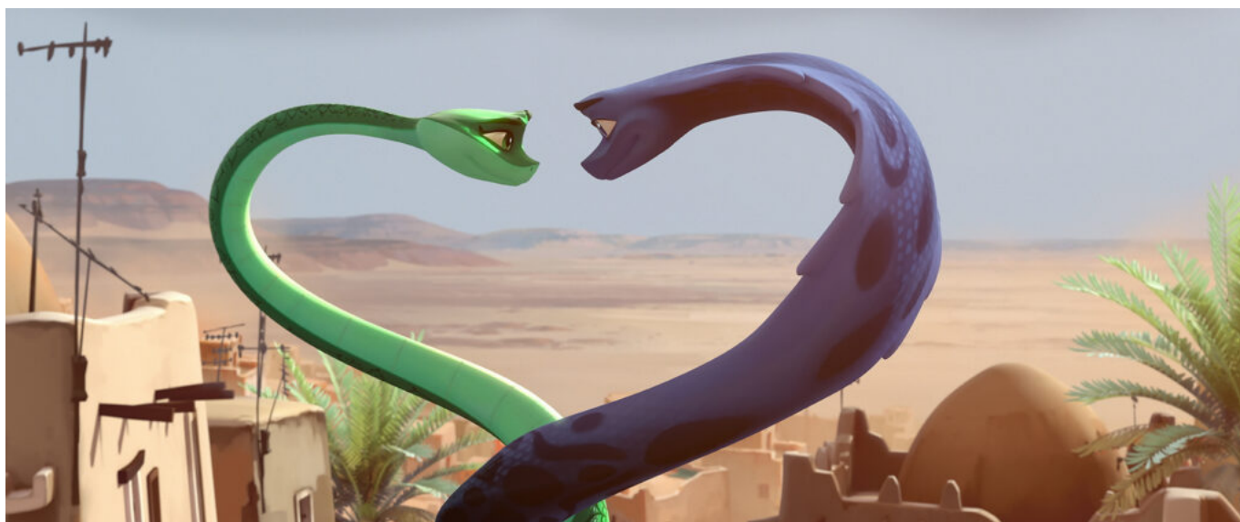
Le long métrage d'animation Sahara est sorti en 2017.