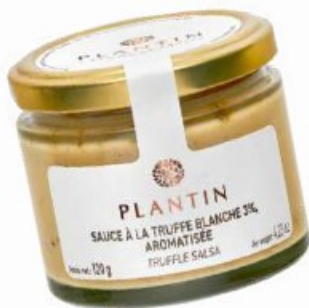
Sauce à la truffe blanche 3%

Ecrit par Mireille Hurlin le 21 août 2024