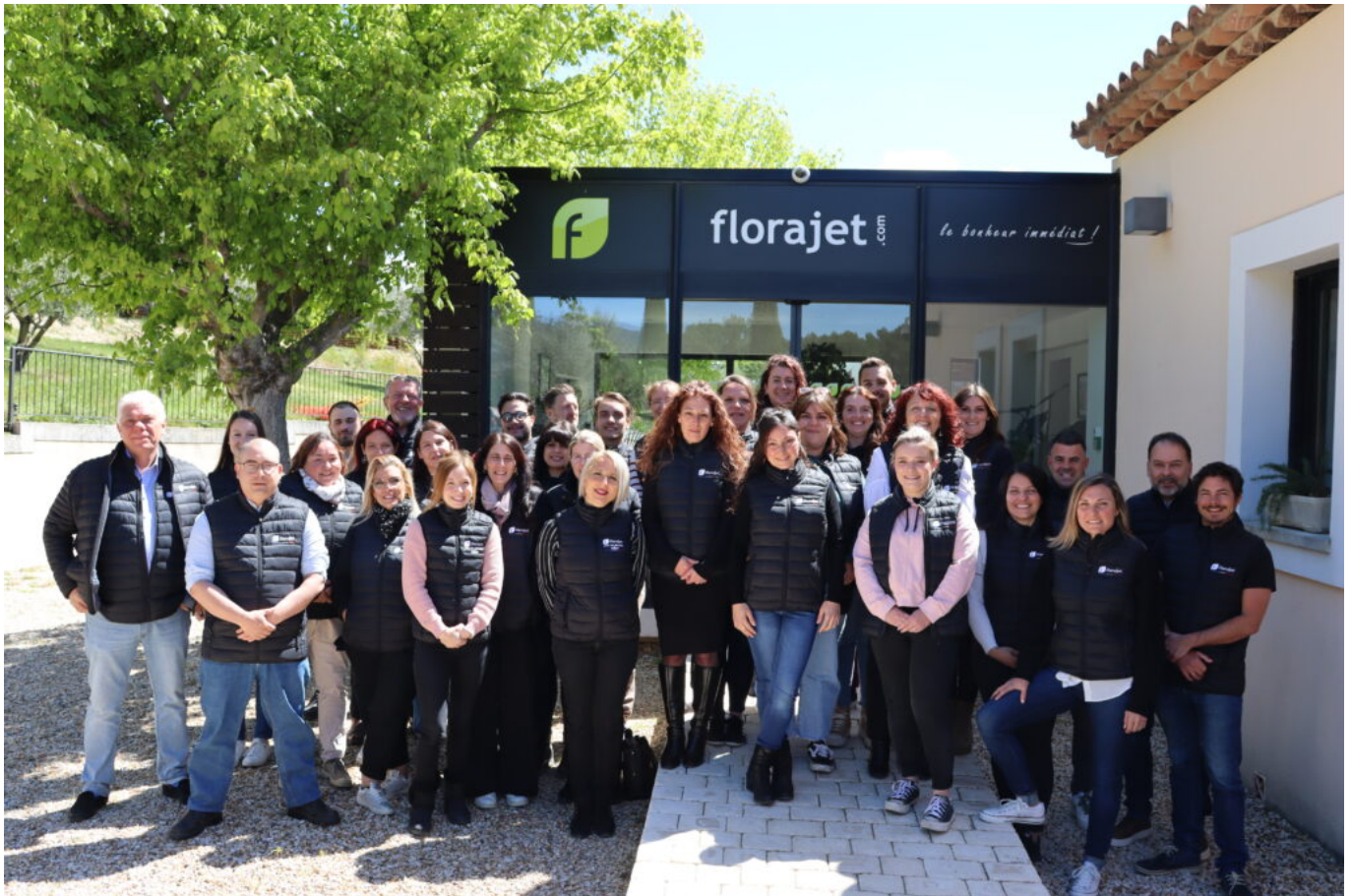
L'équipe de Florajet à Cabrières d'Aigues.

*Étude réalisée par Florajet en collaboration avec Opinionway auprès d'un échantillon de 1 048 personnes représentatif de la population Française âgée de 18 ans et plus, du 3 au 6 mai 2024. Opinionway a réalisé cette enquête en appliquant les procédures et règles de la norme ISO 20252