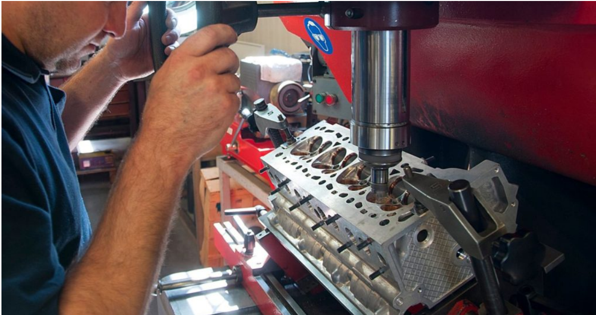
Dans les ateliers de la société Magnet.

Ecrit par Aurélien Tournier le 23 mars 2022