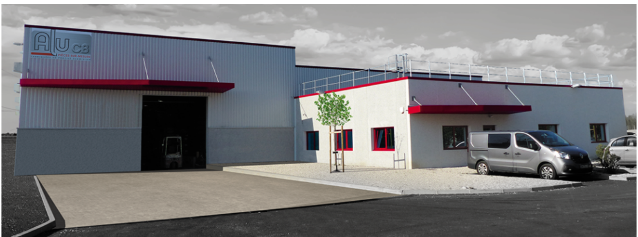
Basée ZAC du plan à Entraigues, Alu CB transforme plus de 600 tonnes de profils d'aluminium par

« Nous sommes spécialisés dans tous les secteurs d'activité, parmi les plus exigeants, explique la PME local. Nos clients sont des professionnels des secteurs de l'aéronautique, le médical & pharmaceutique, la navigation de plaisance, le mobilier urbain, la signalisation, l'automobile, les luminaires, le sport & loisirs, l'agro-alimentaire, les biens d'équipements, le transport & ferroviaire, le bâtiment & photovoltaïque. »