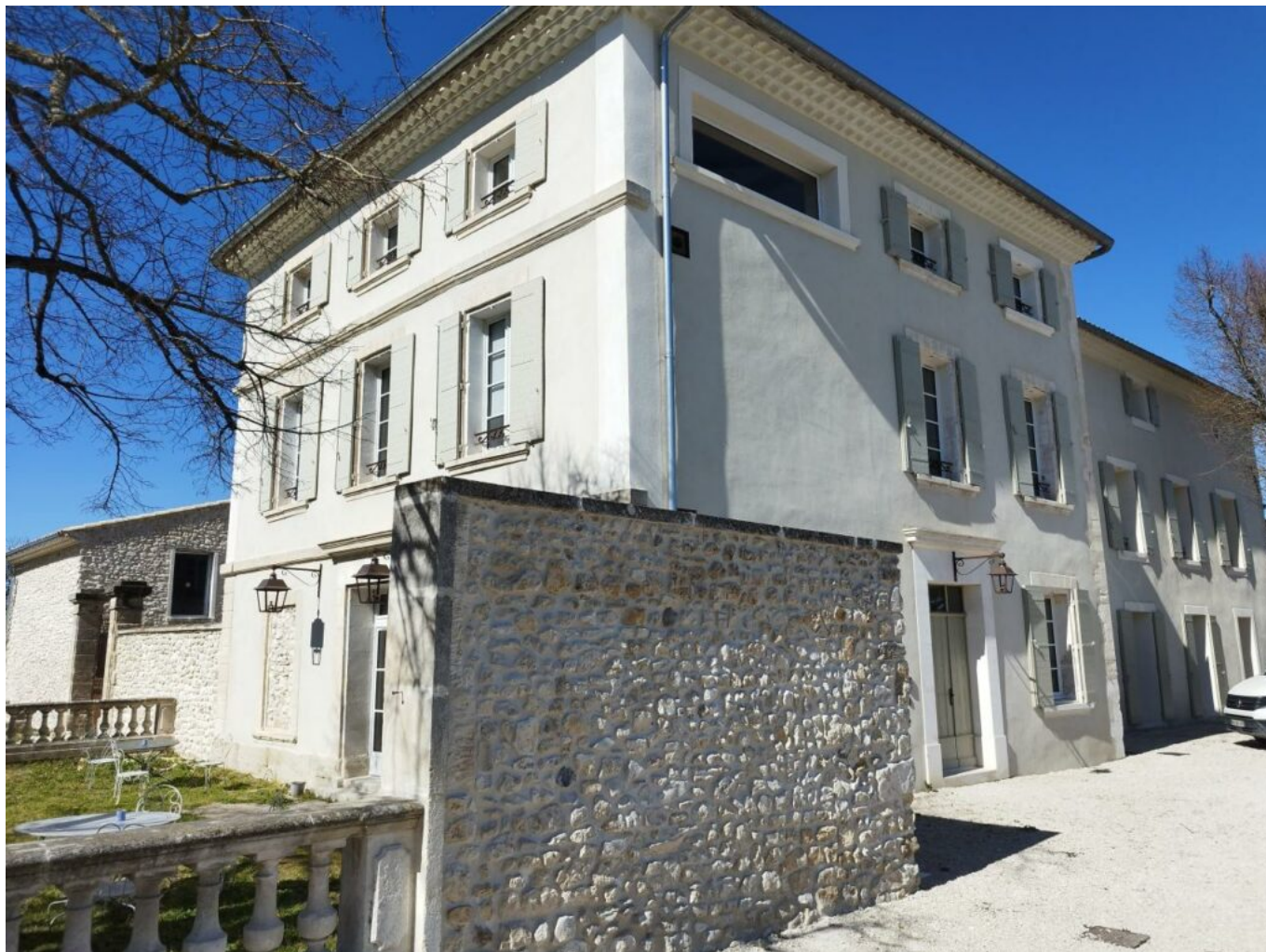
Le siège social situé en pleine campagne a nécessité 3M€ de travaux

Ecrit par Olivier Muselet le 8 avril 2026