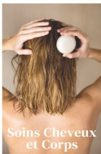
Soins Cheveux et Corps