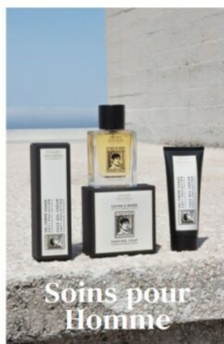
Soins pour Homme