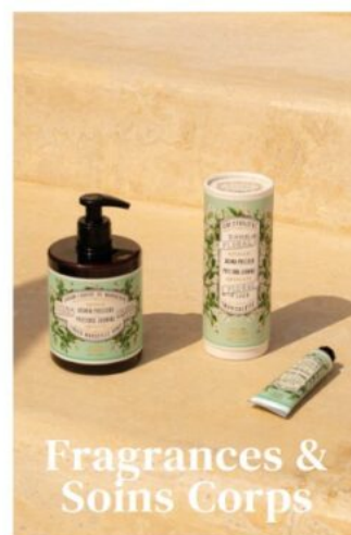
Fragrances & Soins Corps