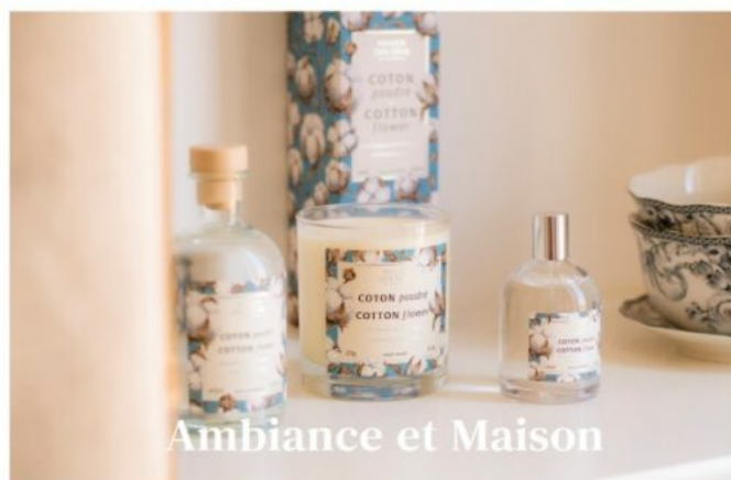
Ambiance et Maison