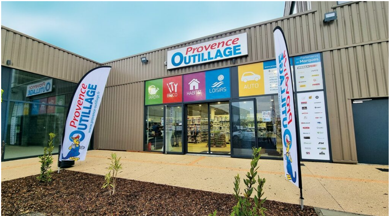
Le magasin de Monteux.