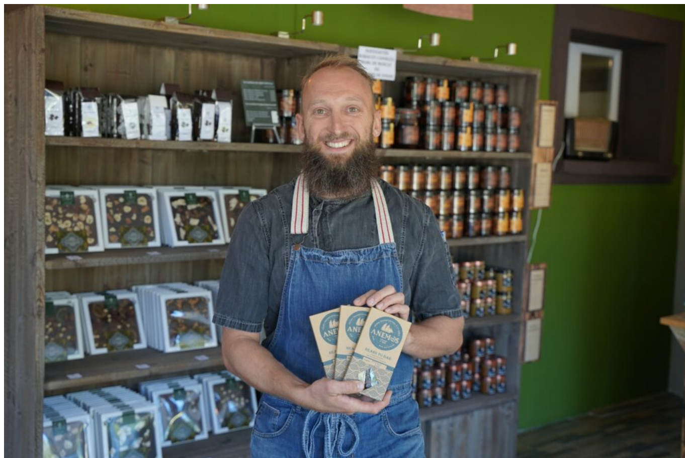
Marc Chaloin © CMAR

ses effectifs en 3 ans, passant de 3 à 6 et les fait travailler 30h par semaine : « Comme ça, ils sont en forme, frais et dispos ». Le bien-être au travail fait partie de son crédo d'entrepreneur engagé ».