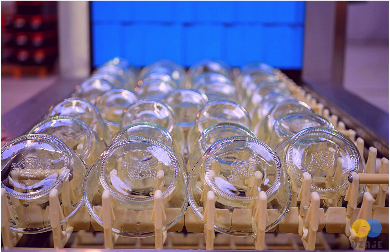
Contenants Uzaje restauration commerciale.

Ecrit par Hervé Tusseau le 11 février 2022