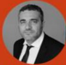
Laurent Garcia L'ECHO DU MARDI