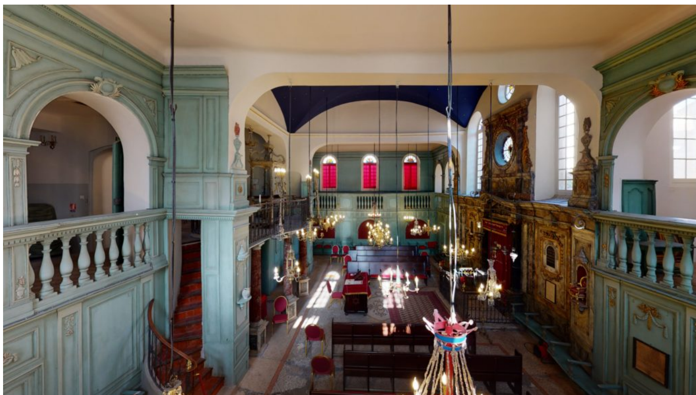
Prise de vue de l'Intérieur de la synagogue de Carpentras réalisée par le procédé.

Ecrit par Mireille Hurlin le 20 janvier 2021