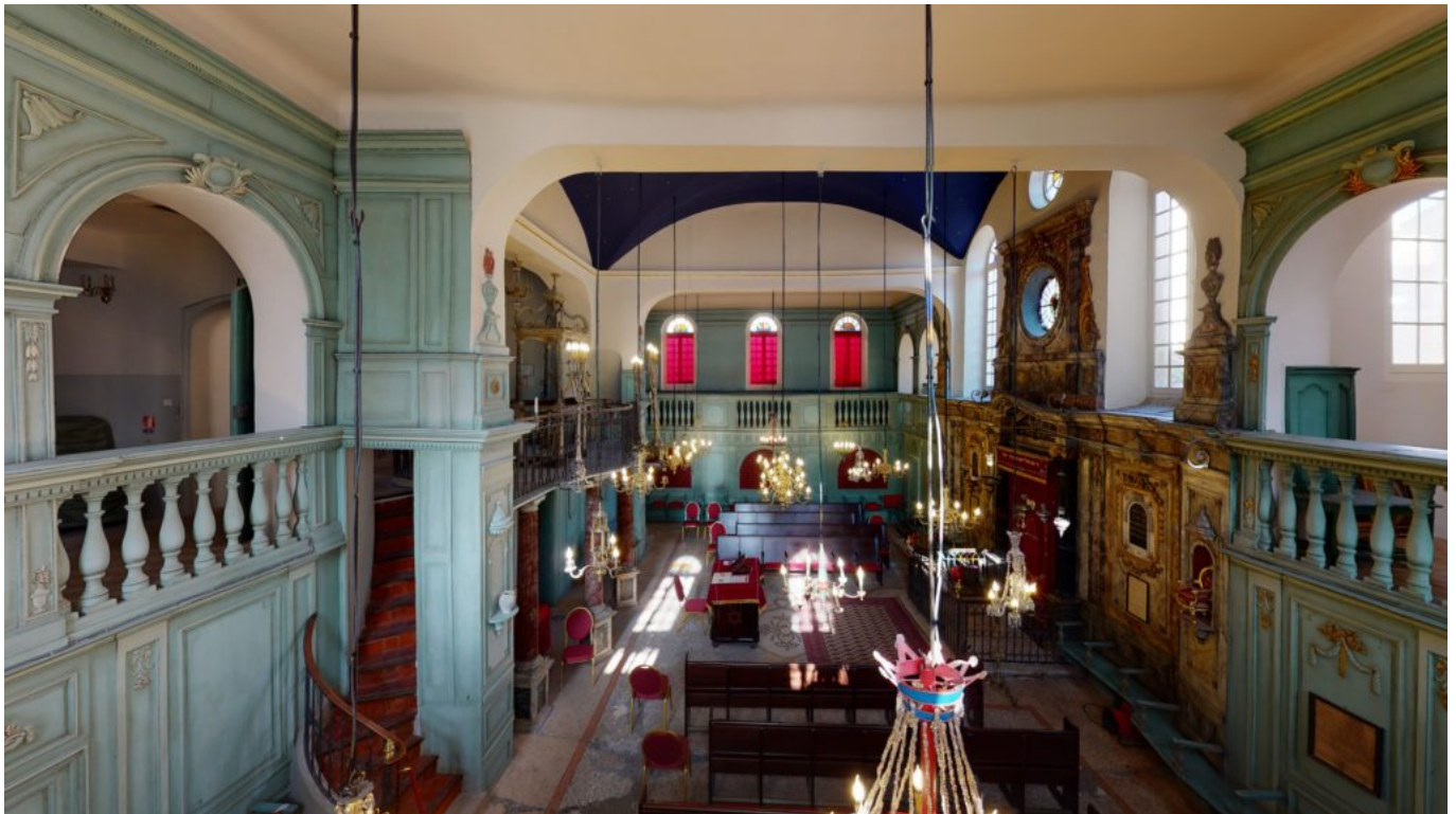
Prise de vue de l'Intérieur de la synagogue de Carpentras réalisée par le procédé.

Ecrit par Mireille Hurlin le 20 janvier 2021