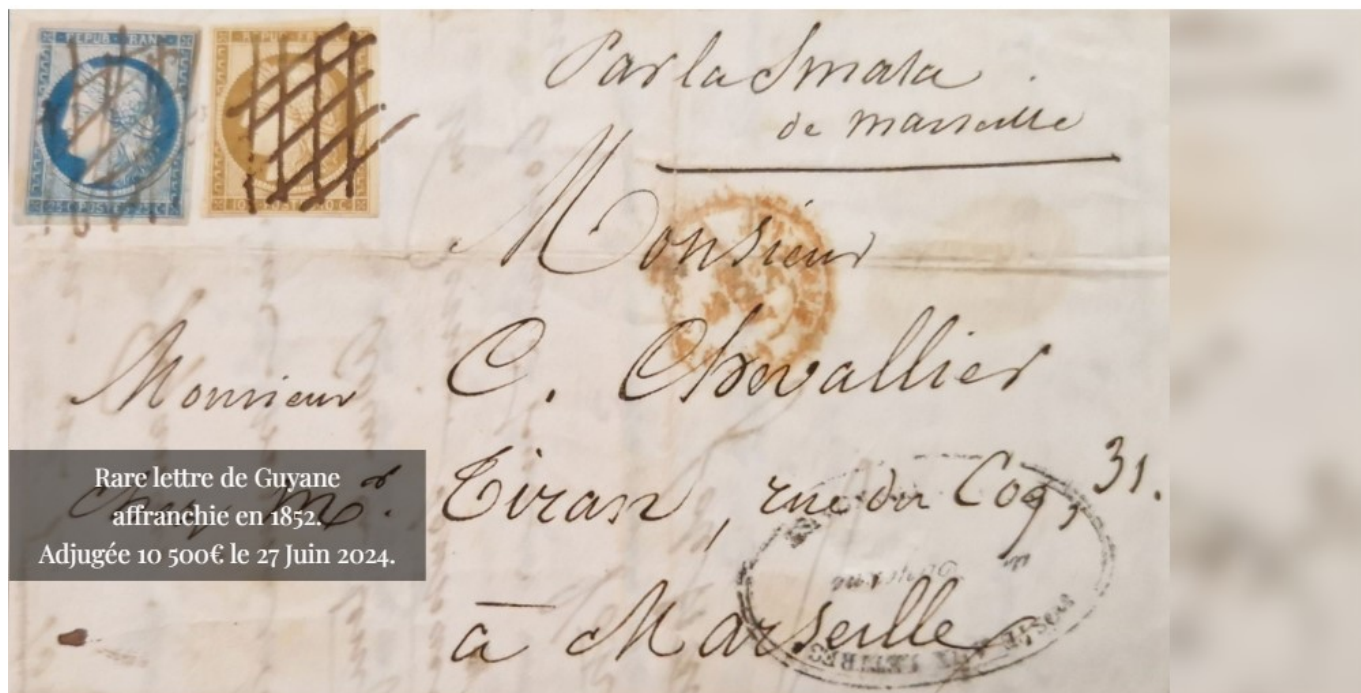
Rare lettre de Guyane affranchie en 1852. Adjudée 10 500€ le 27 Juin 2024.