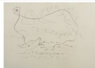
Pablo PICASSO (1881-1973): Jose DELGADO alias Pepe Illo - LA TAUROMAQUIA