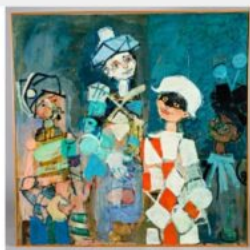
Paul AIZPIRI (1919) : Personnages de la Comedia dell'Arte. Huile