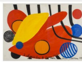
Alexander CALDER (1898-1976): "Halo". Gouache signée Sandy Cald