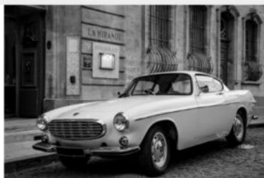
VOLVO P1800 S – 1969 Compteur non garanti : 45 666kms – N° Série 183451028314 Voiture emblématique de Simon Templar alias Le Saint, voulu par un constructeur suédois, dessiné...