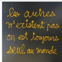
BEN (1935) BENJAMIN VAULTIER (dit) " Les autres n'existent pas on est toujours seul au monde". Acrylique sur toile 2005. Signée et datée au dos."ben 2006" Copie de certificat d'authenticité...