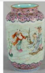
CHINE - XIXe siècle : Vase rouleau en porcelaine à décor émaillé