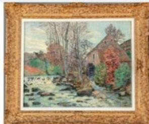
Armand GUILLAUMIN (1841-1927) : Moulin Charrault (dit Bouchardon). Huile sur toile signée en bas à droite, titrée sur le châssis et numérotée 21314. Dim. : 65,5x71 cm....