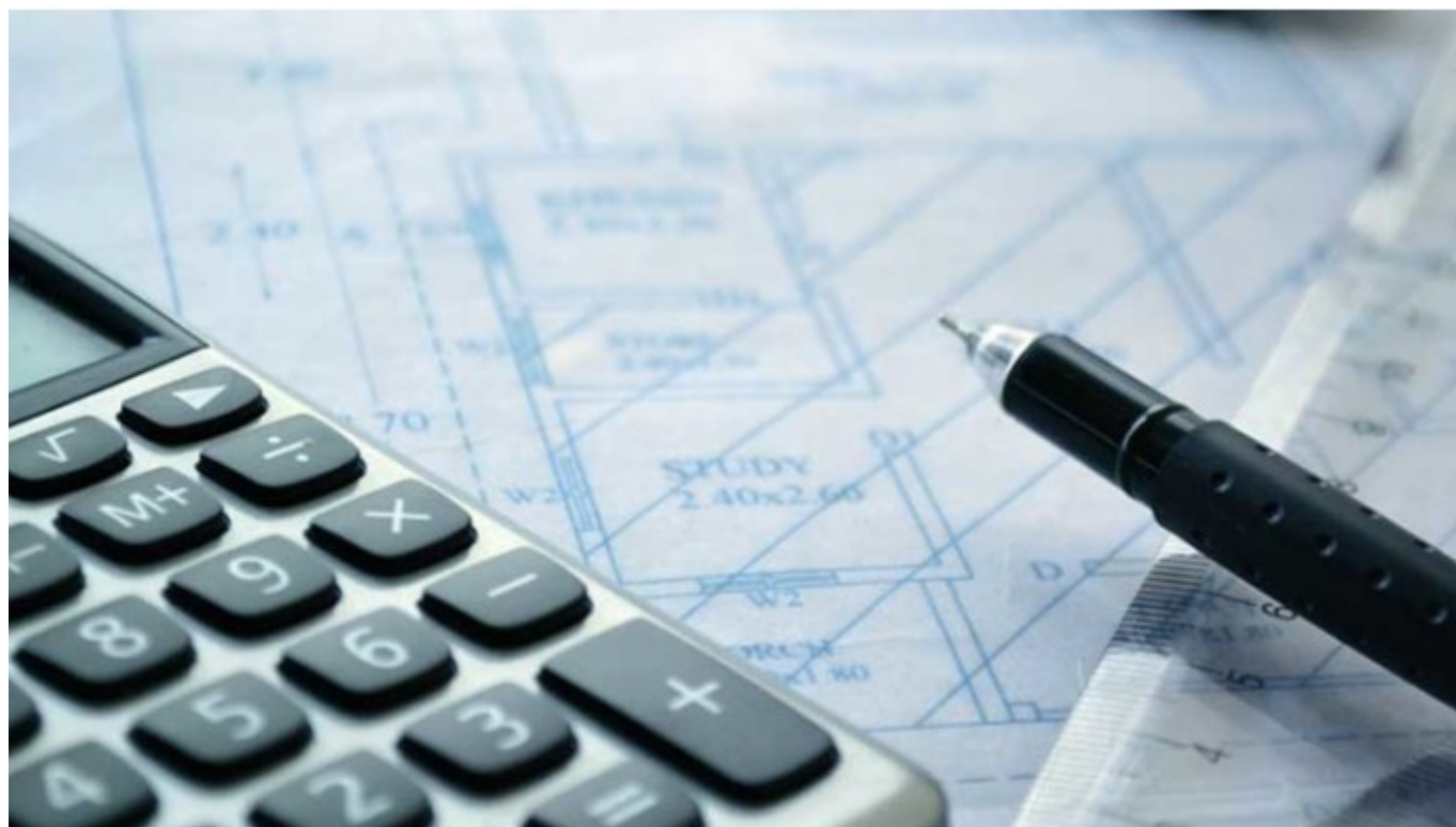
Indexation du loyer

Face à ce constat, la loi pouvoir d'achat liste les défauts des logements qui ne peuvent faire l'objet de complément de loyer. Ainsi, un logement ne pourra plus faire l'objet d'un complément de loyer : S'il dispose de sanitaires sur le palier ; En présence de signes d'humidité sur certains murs ; S'il est de classe F ou G s'agissant de son niveau de performance énergétique ; Si des fenêtres laissent anormalement passer l'air (hors grille de ventilation) ; En présence d'un vis-à-vis de moins de dix mètres ; En cas d'infiltrations ou d'inondations provenant de l'extérieur du logement ; En cas de problèmes d'évacuation d'eau au cours des trois derniers mois ; En présence d'une installation électrique dégradée ; En cas de mauvaise exposition de la pièce principale.