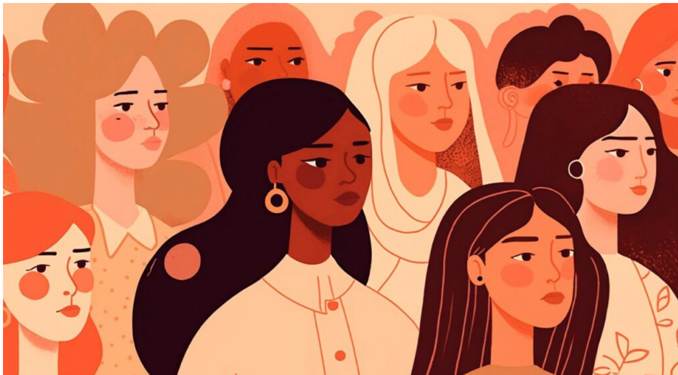
Table ronde sur le droit des femmes à disposer de leur corps

À l'occasion de la Journée internationale des droits des femmes, le CER (Centre d'enseignement et de recherche) Droit d' Avignon université et le Barreau d'Avignon organisent une table ronde sur le droit des femmes à maîtriser leur corps. Cinquante ans après la loi Veil et un an après l'entrée dans la Constitution de la liberté garantie de recourir à l'IVG, où en sommes-nous aujourd'hui ? De la contraception à la GPA, en passant par les violences sexuelles et gynécologiques, cette conférence reviendra sur les grandes étapes de l'émancipation du corps des femmes et ouvrira le débat sur les enjeux actuels.