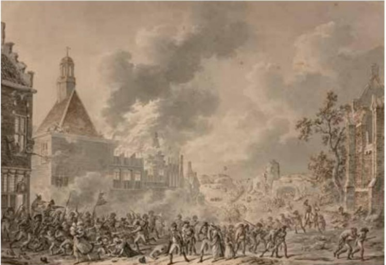
Scène de pillage et d'incendie de Dirk Langendyk