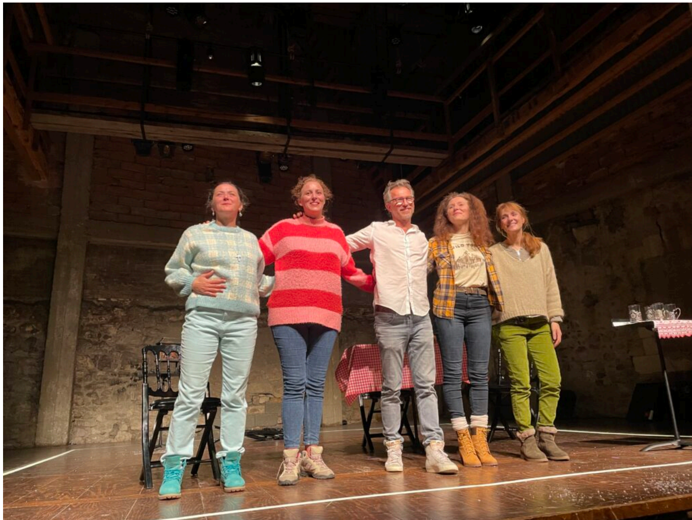
Le metteur en scène entouré des comédiennes

Après coup. Théâtre des Carmes André Benedetto. 6, place des Carmes. Jusqu'au 26 juillet. Relâches les 13 et 20 juillet. 19h25. De 10 à 20€. A partir de 12 ans. 04 90 82 20 47.