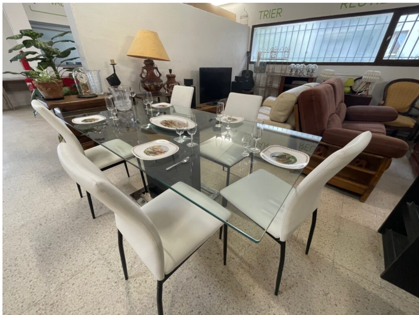
Un mobilier en parfait état