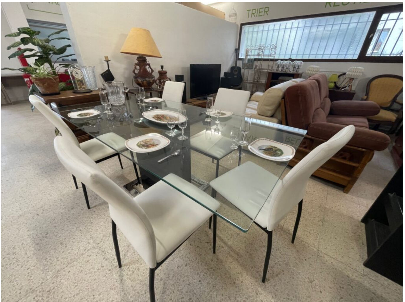
Un mobilier en parfait état