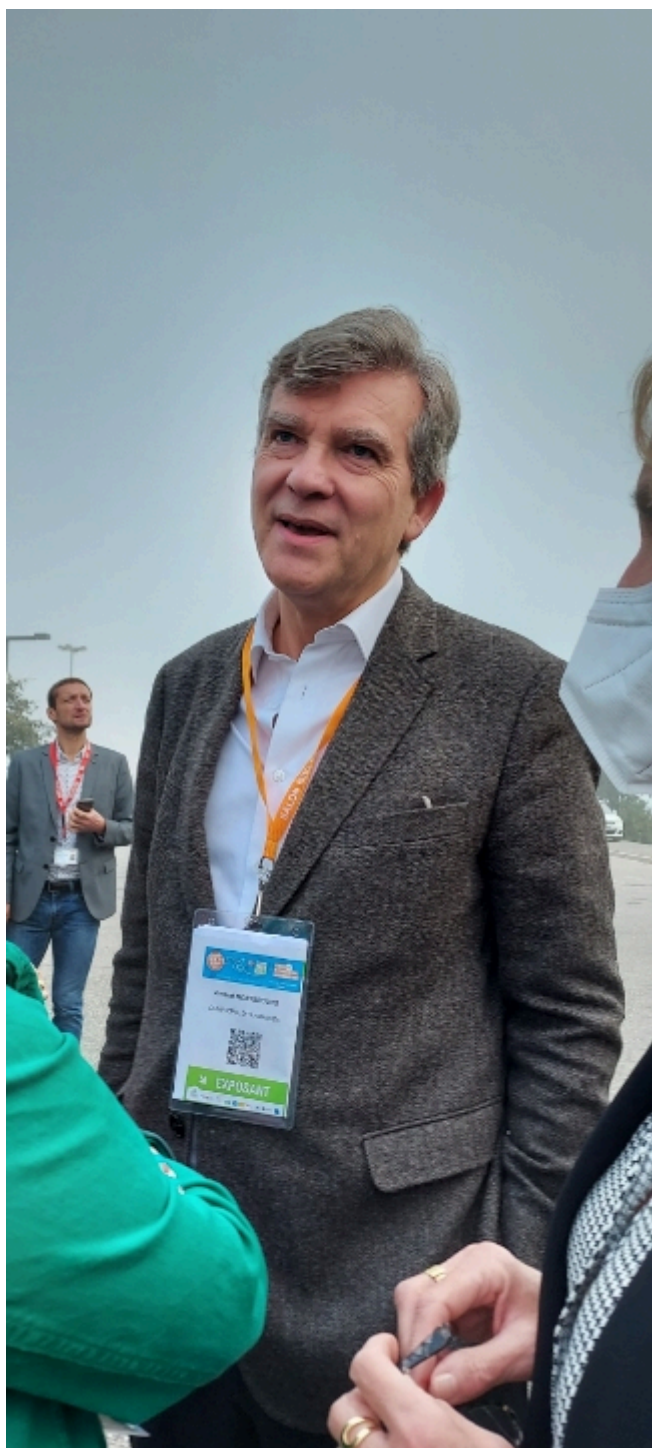
Arnaud Montebourg