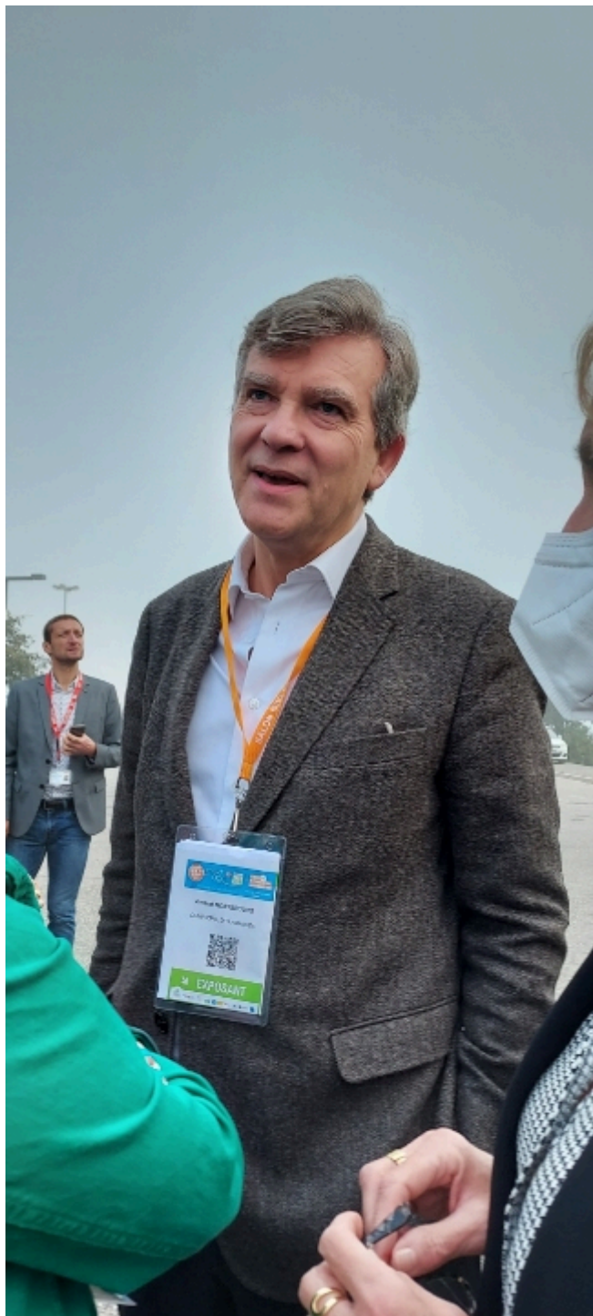
Arnaud Montebourg