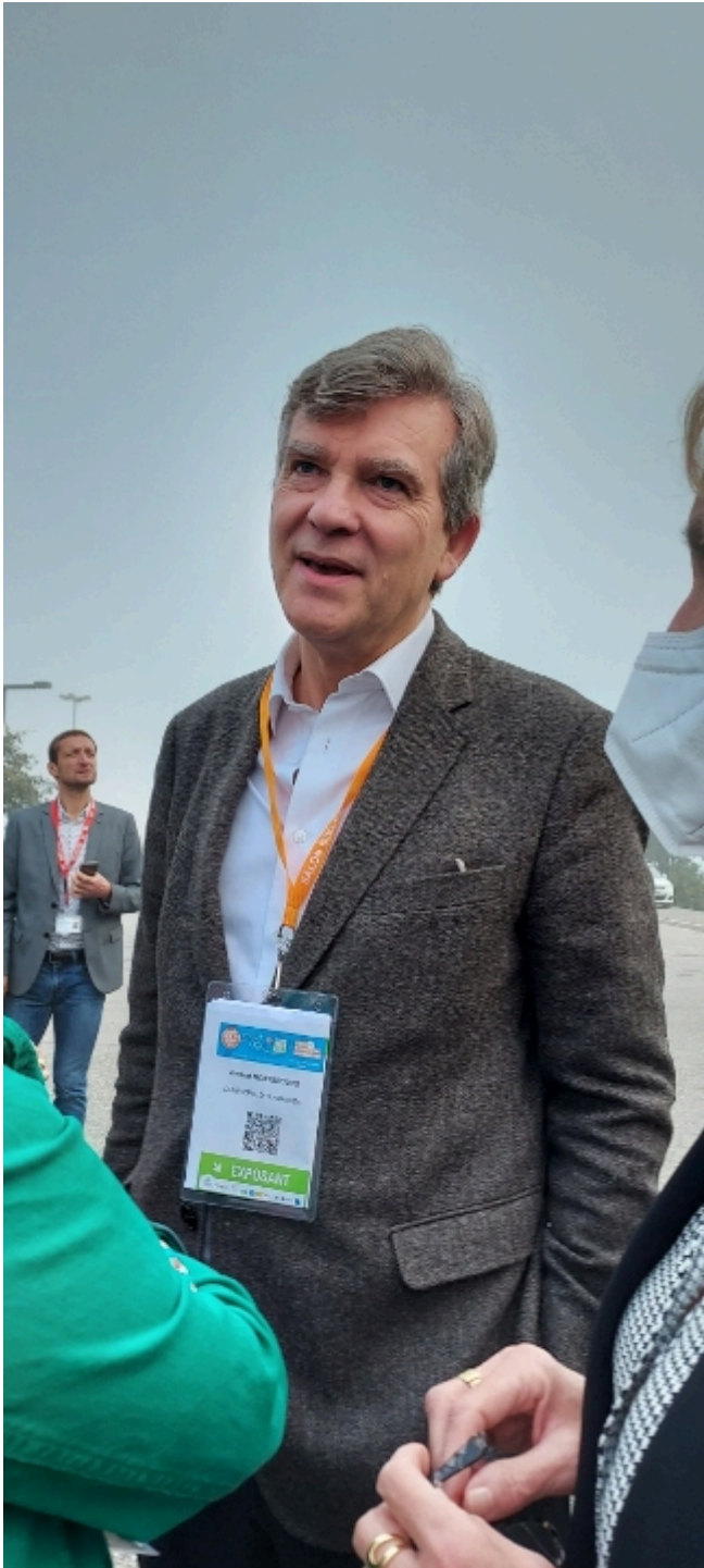
Arnaud Montebourg