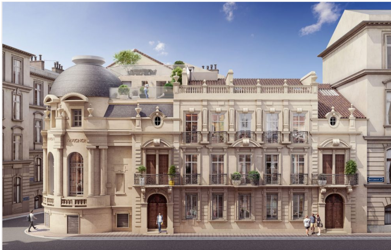
Vue d'ensemble DR Cabinet d'architecture Fluor

«La réhabilitation de la Maison du Chevalier Folard en 14 logements a pour objectif architectural un minimum d'impact sur rue et une requalification cohérente de mise en valeur de l'espace sur cour, lit-on sur le site de d'architecture Fluor . Cette cour protectrice du vent et du soleil de Provence est transformée grâce à une résille métallique implantée en applique des coursives existantes. Le dessin savant de cette résille répond à la logique de composition d'Architecture Eclectique du XIXe de la façade rue Joseph Vernet. Les espaces extérieurs sont généralisés à l'ensemble des logements par la cour, les coursives, les balcons et la création de 3 terrasses autour du dôme zénithal emblématique. Le platane centenaire habite la cour de sa présence bienveillante.»