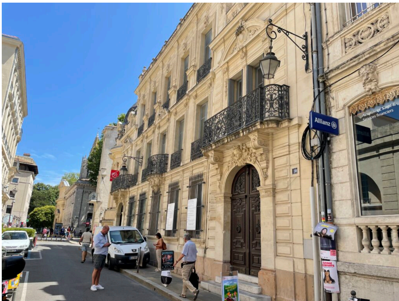
Vue actuelle de la rue

Ecrit par Mireille Hurlin le 7 juillet 2023