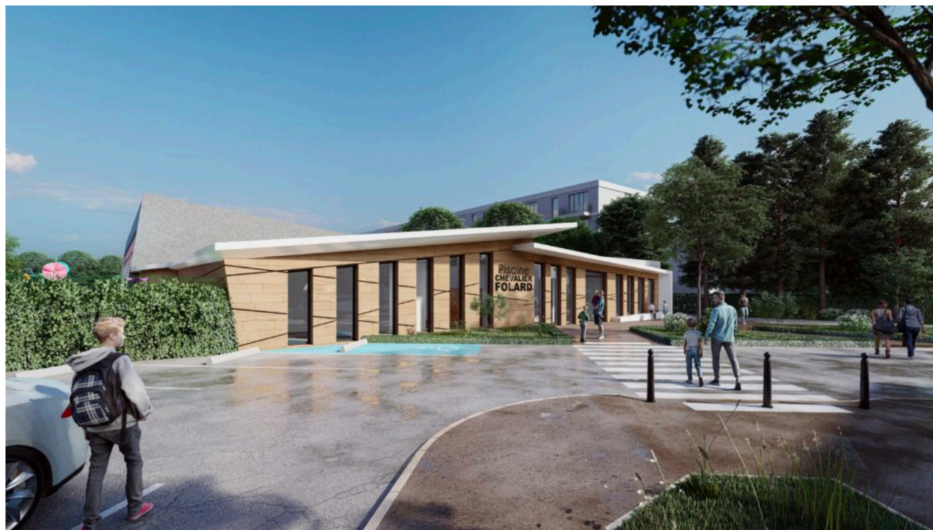
Futur extérieur de la piscine Chevalier de Folard

Dans les faits ? L'opération avoisinera les 19M€ dont un peu plus de 10M€ dévolus à conception-rénovation-réalisation et plus de 8M€ à l'exploitation et la maintenance. Tout commencera en décembre 2021 où chaque piscine entamera 12 mois de travaux, les unes après les autres afin de ne pas immobiliser toutes les activités nautiques « qui s'étendent des bébés nageurs à l'aquagym pour séniors » précise Cécile Helle. Pour les piscines Jean Clément situées 305, chemin de la Martelle, quartier de Montfavet et Stuart Mill, chemin de Malpeigné, les travaux se feront de décembre 2021 à décembre 2022. Pour Chevalier Folard, érigée dans l'avenue éponyme, les travaux s'effectueront de décembre 2022 à décembre 2023 et pour Pierre Reyne, rue Velouterie, dans l'intramuros, de décembre 2023 à décembre 2024.