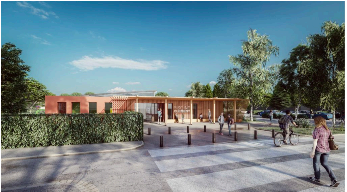
Futur extérieur de la piscine Jean Clément

«La plupart du temps vous voyez ces piscines, comme ça a été le cas pour le stade nautique, fermées, oubliées, laissées à l'abandon alors qu'elles sont des enjeux du territoire, reprend le maire. Et puis avec les températures auxquelles nous sommes confrontés en saison estivale, qui ne rêve pas de fréquenter ces lieux où l'on peut se rafraîchir et se reposer en famille, grands-parents, parents, enfants, petits-enfants, ensemble, parfois même en profitant d'un extérieur. C'est ce à quoi j'ai assisté, cet été, en me rendant au stade nautique où l'ambiance était paisible.» Justement c'est le point noir des piscines où les ados turbulents sont montrés du doigt, évinçant la tranquillité des familles et des plus petits ? « Pas quand on a mis en place des animations et cela a fait tout la différence, » souligne le premier magistrat de la ville. En termes de chiffre de fréquentation ? Le stade nautique devrait accueillir, dans une année normale, 200 000 personnes. Les autres piscines ? Peut-être tout autant... » considère l'édile.