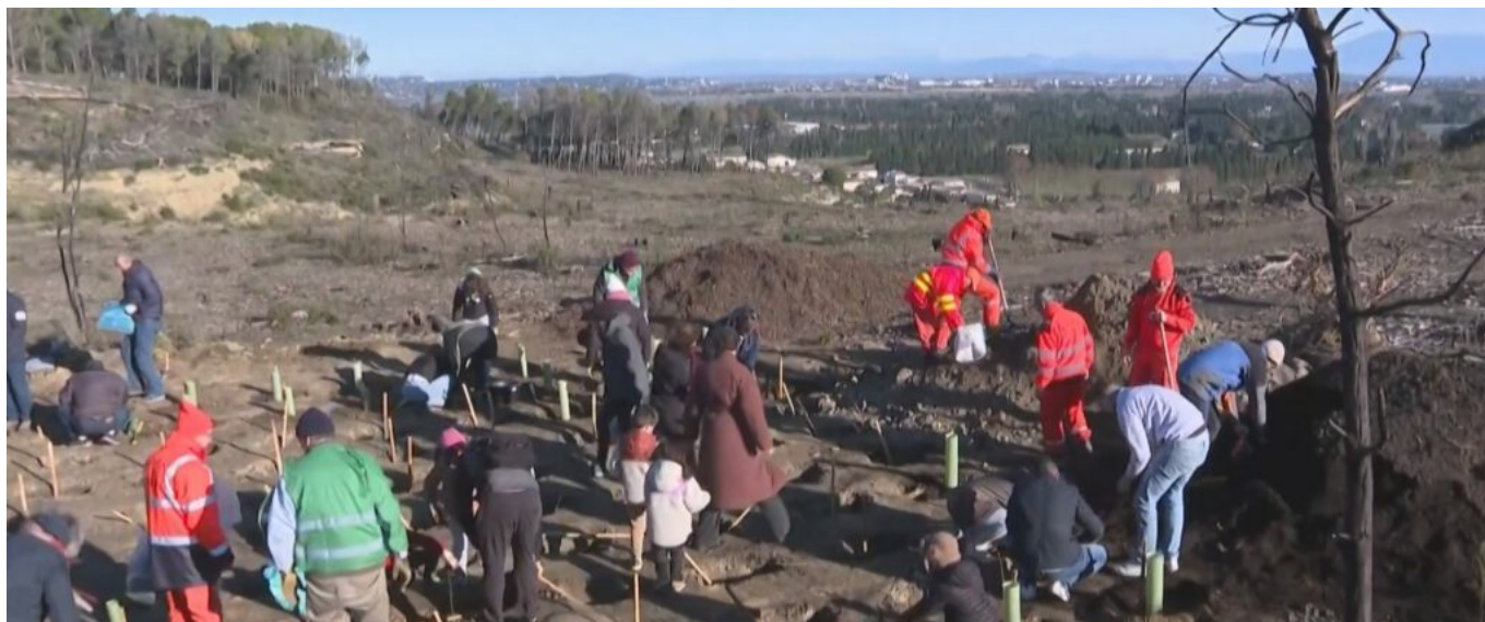
Les premières plantations de feuillus lors de la première opération test menée en partenariat avec

Jean-Christophe Daudet, maire de Barbentane