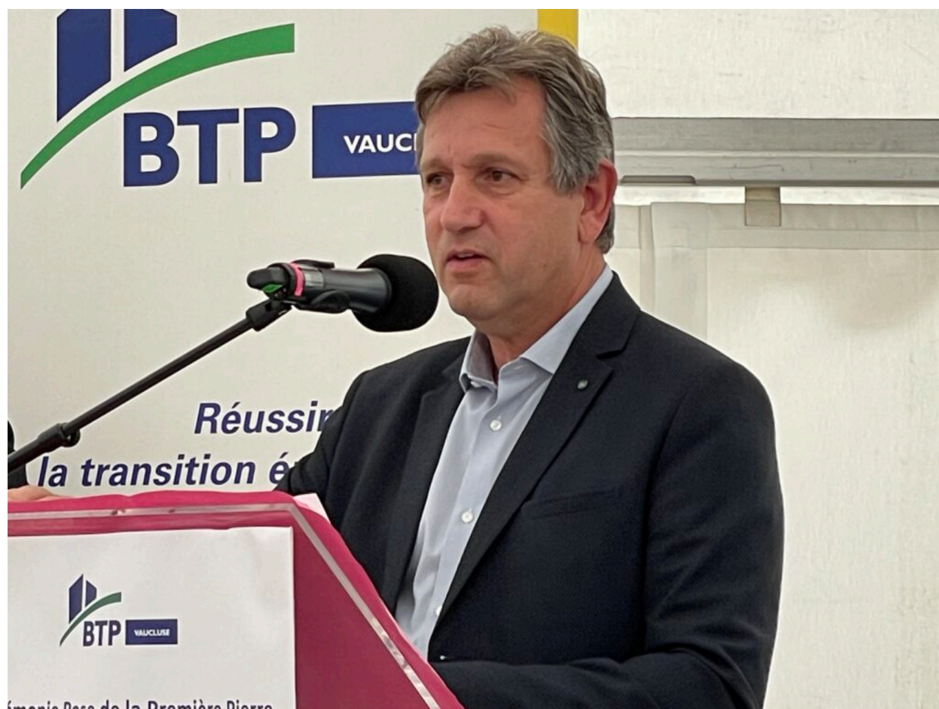
Thierry Lagneau Copyright MMH

s'est ouverte à sa première rentrée. La bibliothèque Renaud-Barrault, bâtiment des années 1970, passoire énergétique a été totalement rénovée. Le parvis de la gare Centre d'Avignon avec l'aide de la Région et la SNCF, a également été complètement réinterprété. Ces projets emblématiques de renouveau représentent des dizaines de millions d'investissement et non pas du déficit public mais de l'activité pour nos entreprises. Ces réalisations maintiennent l'attractivité de nos territoires parce que les élus locaux font le pari de leur territoire. Ce sont aussi des entreprises, des hommes et des femmes du BTP, des architectes qui ramènent le beau dans la ville, ce qui est une dimension importante.»