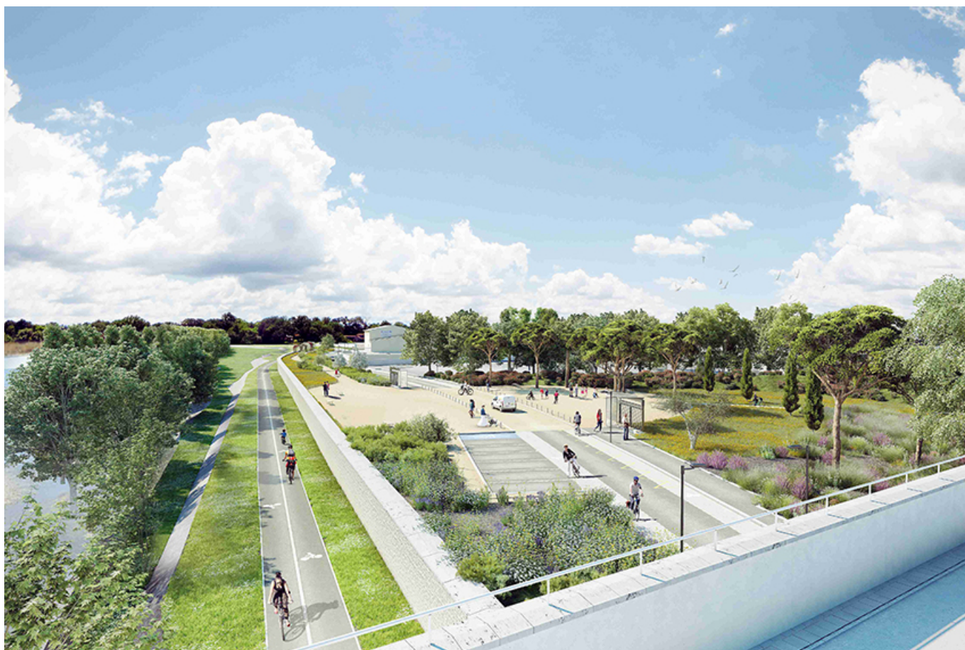
Ce à quoi va ressembler le carrefour de Bonpas fin 2027.

Ecrit par Vanessa Arnal-Laugier le 13 mai 2025