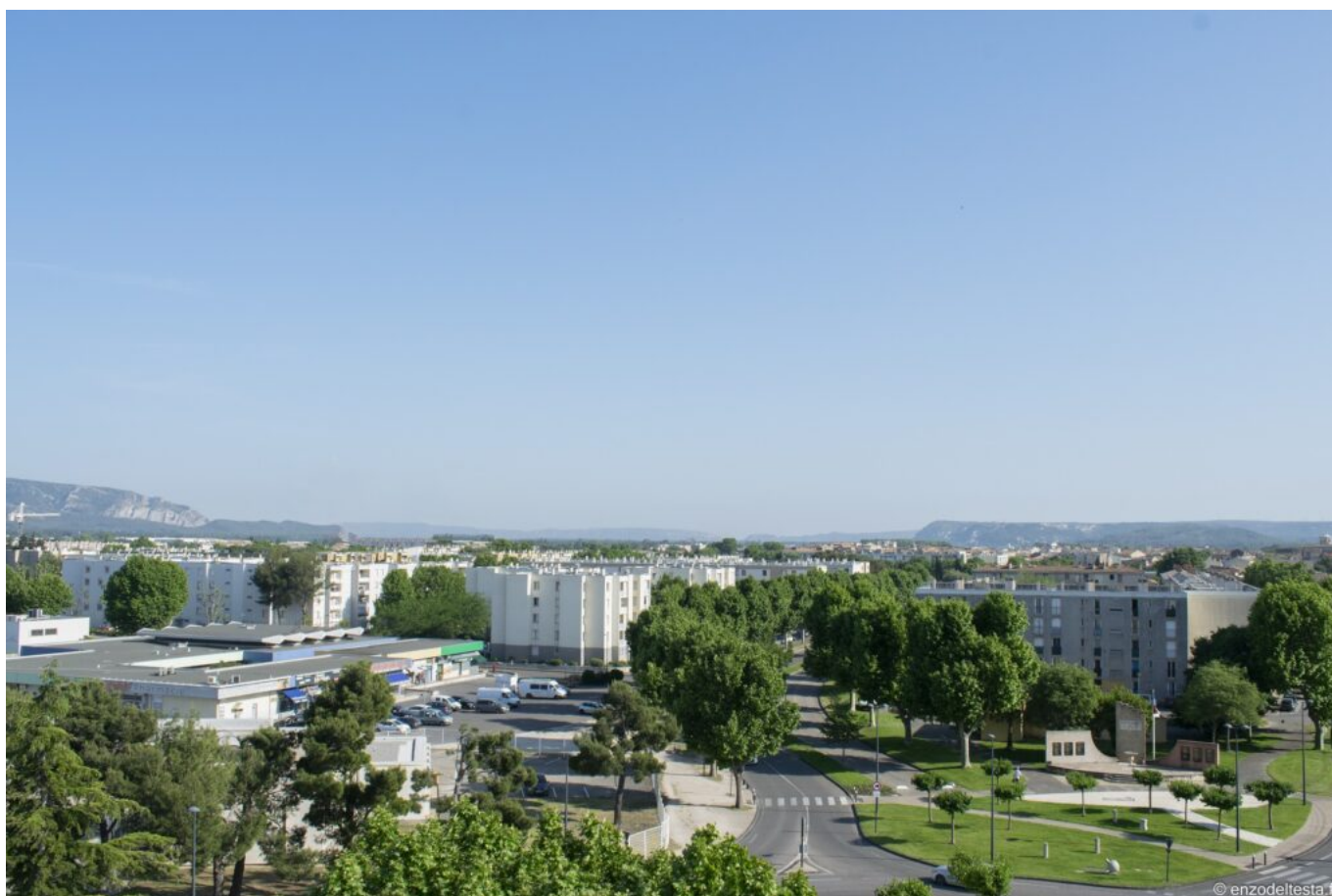
Vue du quartier du Docteur Ayme sans les 2 tours.

« La Ville de Cavaillon accompagnera chaque famille dans un relogement conforme à ses besoins, insiste le maire de la cité cavare. Nous avons également obtenu des financements supplémentaires pour que les réhabilitations à venir soient réalisées avec un haut niveau d'exigence environnementale (Bâtiments basse consommation). Les voiries et les espaces publics seront reconfigurés, sécurisés et embellis par la commune. Par ailleurs, j'ai acté l'implantation forte de services publics en cœur de quartier. Cet engagement a sans nul doute contribué à convaincre l'Anru du bienfondé du dossier de Cavaillon. Cela concernera notamment la construction de nouveaux locaux pour le centre social, France Services et le Point Justice, d'un nouvel accueil pour les jeunes, d'une salle multi-activités, d'une halte-garderie par l'agglomération et d'un nouveau plateau sportif. »