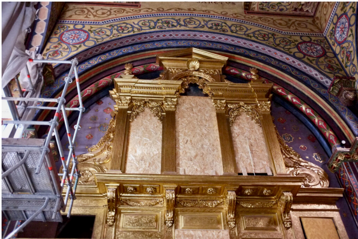
le cœur

Ecrit par Didier Bailleux le 19 septembre 2024