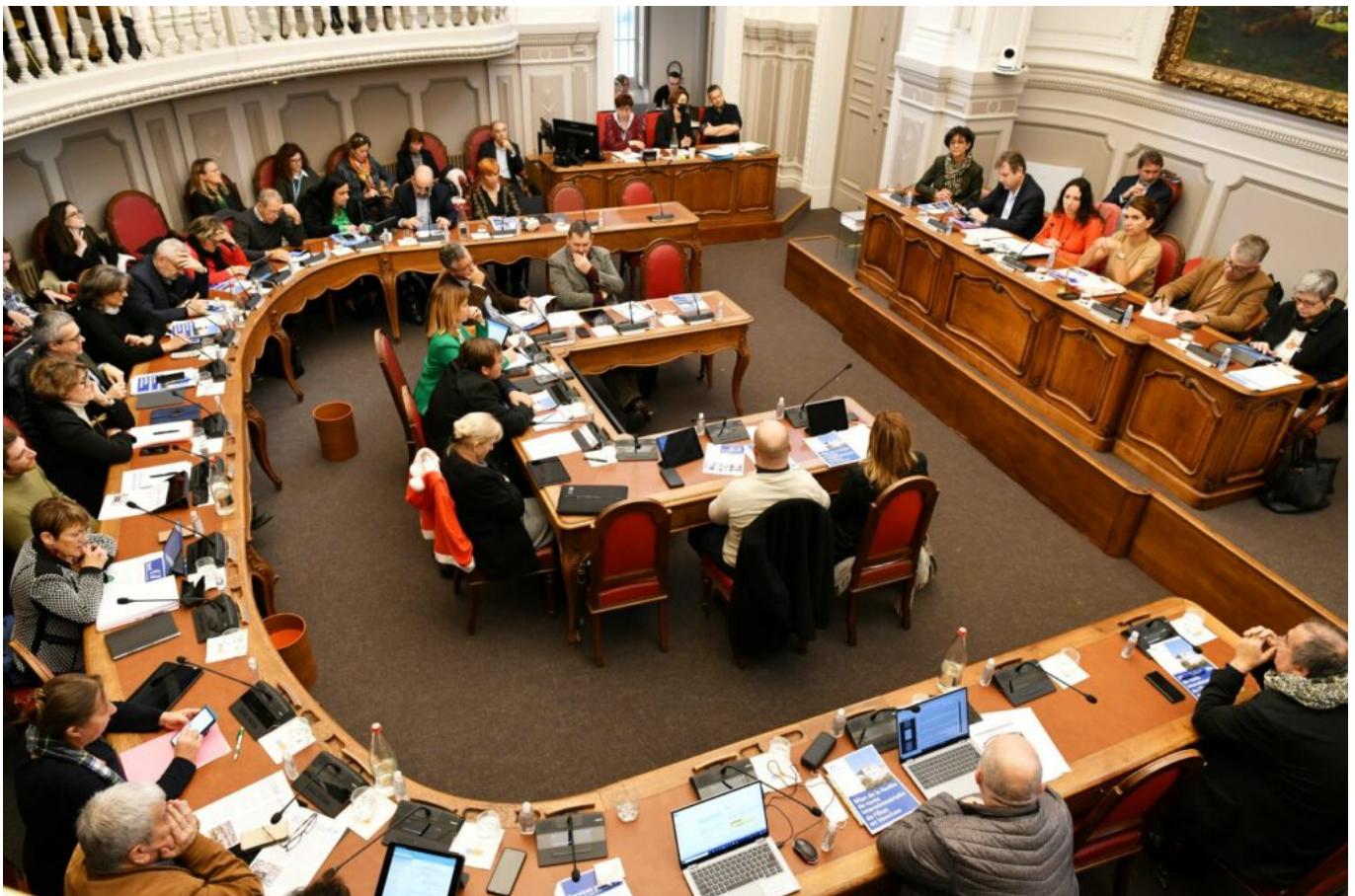
Les conseillers départementaux attentifs à la parole de la représentante de l'Etat en Vaucluse

La préfète continue de détailler sa feuille de route : pour l'éducation, il faut accélérer les efforts, doubler les effectifs dans les REP (Réseaux d'éducation prioritaire), pas plus de 24 élèves par classe et aussi offrir une scolarisation inclusive aux enfants handicapés, à ce jour le but de 90 unités d'inclusion est quasiment atteint. Pour lutter contre les déserts médicaux, les structures de soins doivent être multipliées. Il existe 24 maisons de santé, dans le cadre du Covid, 20 centres de vaccination et de dépistage ont été mis en œuvre.