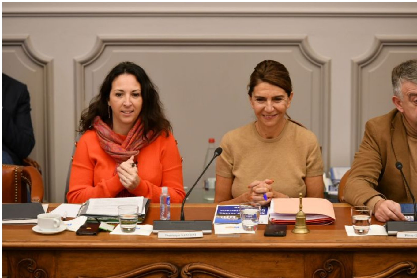
Violaine Démarêt, préfète de Vaucluse (à gauche) et Dominique Santoni, présidente du Conseil départemental de Vaucluse.

9 politiques prioritaires et 5 projets structurants spécifiques au Vaucluse. »