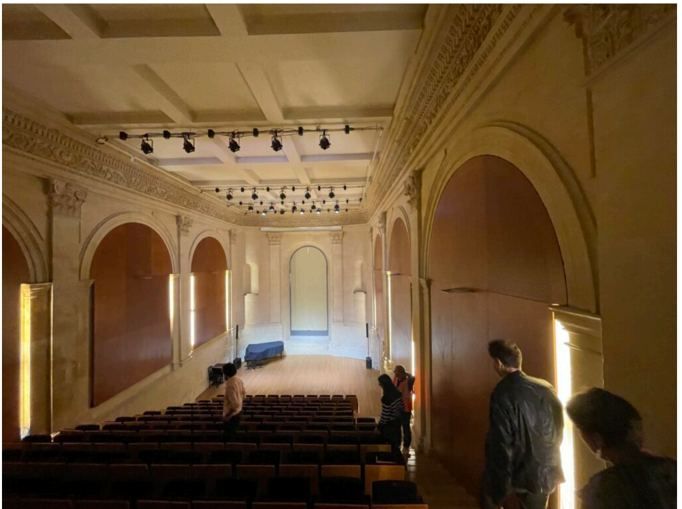
La salle de concert Rosa, ancienne chapelle

Le Conservatoire à rayonnement régional accueille plus de 3 000 élèves, dont 500 issus des écoles associées et propose des formations artistiques aux enfants comme aux adultes. Le bâtiment classé du XVIIe siècle est racheté au Département -estimé par les Domaines à 1,52M€- par le Grand Avignon en 2005 et ouvert au public en 2007 après plus de 7M€ de travaux.