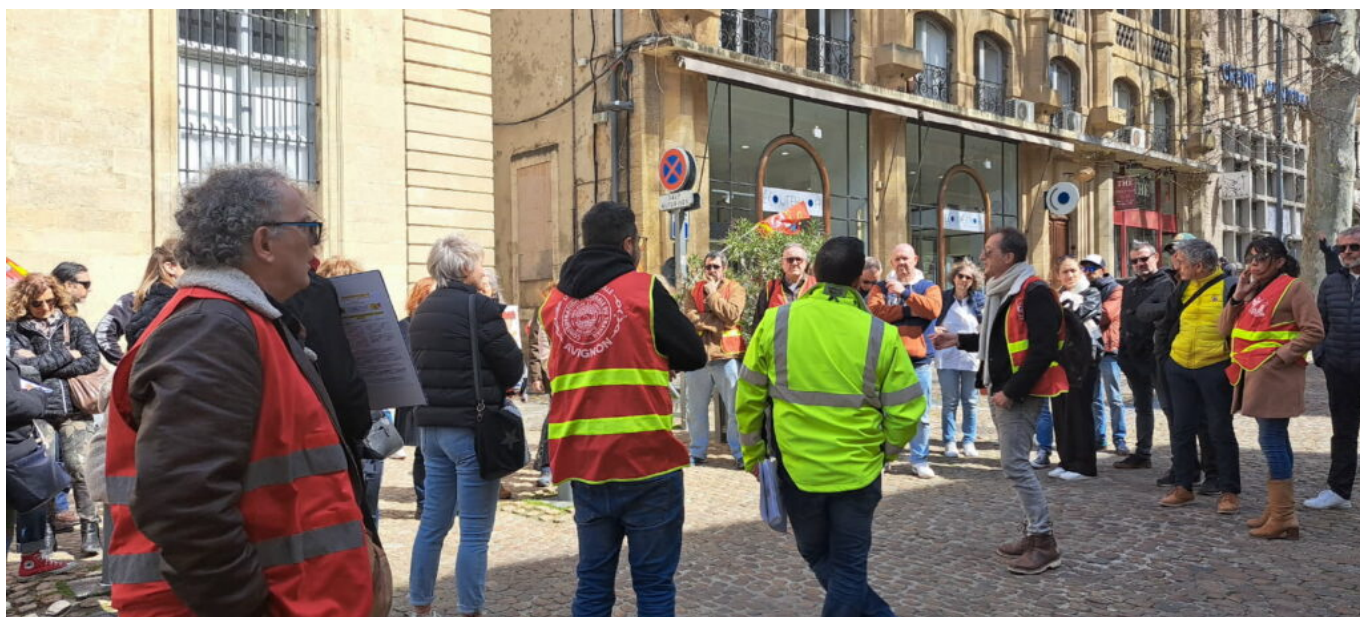
Un appel à une manifestation inter-syndicale et unitaire a été lancé pour le 3 avril à Avignon

Ecrit par Andrée Brunetti le 31 mars 2025