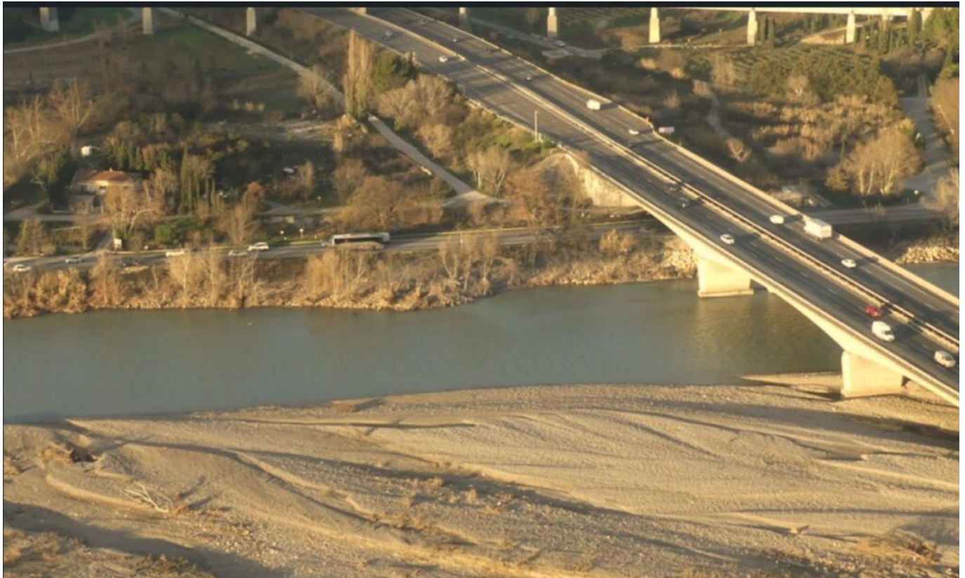
Digue de la Durance

Depuis 2018, la Communauté d'Agglomération du Grand Avignon assure la compétence pour la gestion des milieux aquatiques et de prévention des inondations. Le Syndicat Mixte d'Aménagement de la Vallée de la Durance (SMAVD), expert en conduite de projets et de travaux dans les cours d'eau, se charge de la gestion de la rivière ainsi que de la préservation des zones humides.