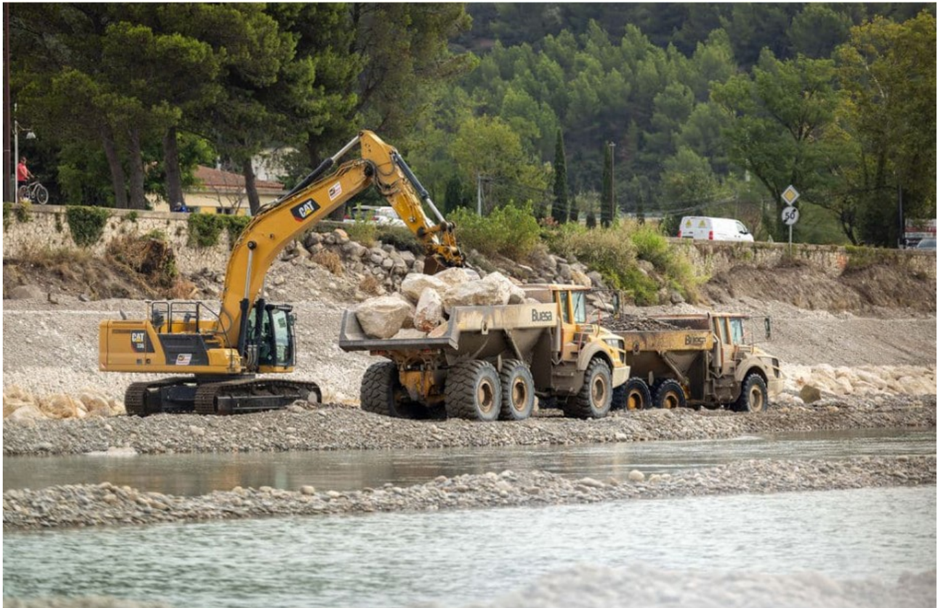
Travaux sur la digue de la Durance

Ecrit par Mireille Hurlin le 16 avril 2025