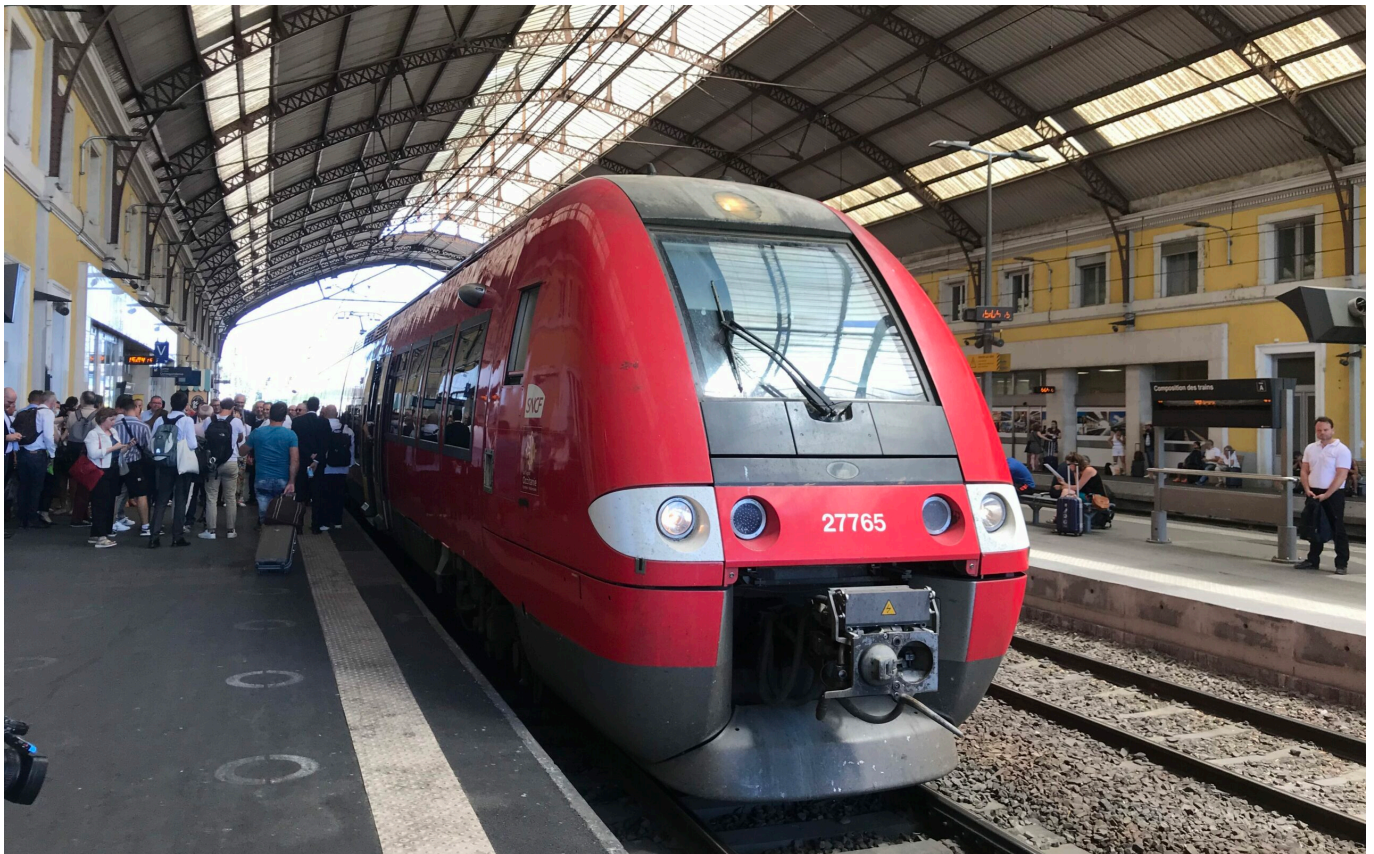
Le TER Lio d'Occitanie lors des essais et de la présentation en gare-centre d'Avignon.

« Je me suis toujours battue pour le train, insiste Carole Delga , présidente du Conseil régional d'Occitanie. Pour les trains à grande vitesse, qui désenclavent nos territoires et pour les trains du quotidien qui facilitent la vie. »