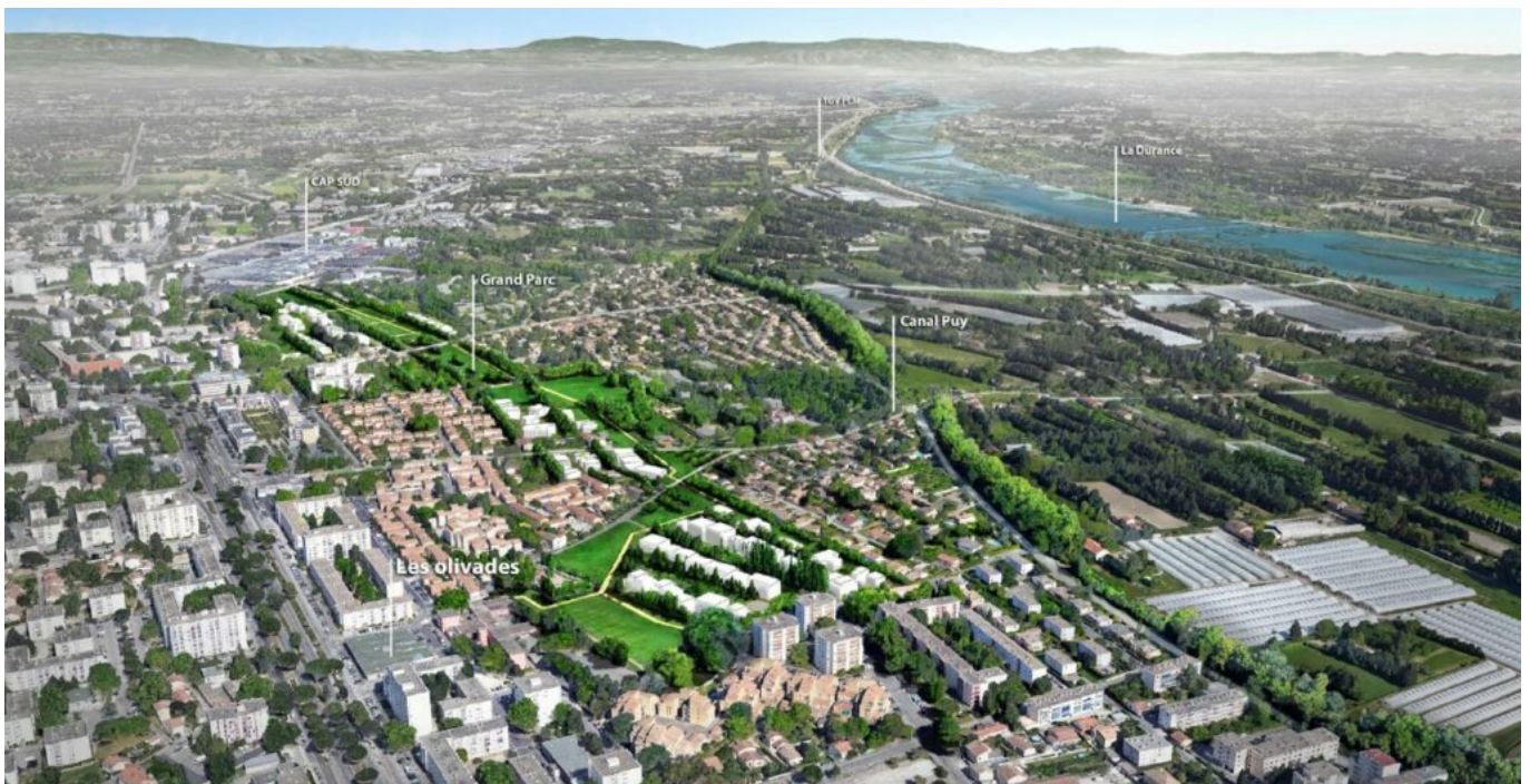
L'éco-quartier de Joly-Jean.