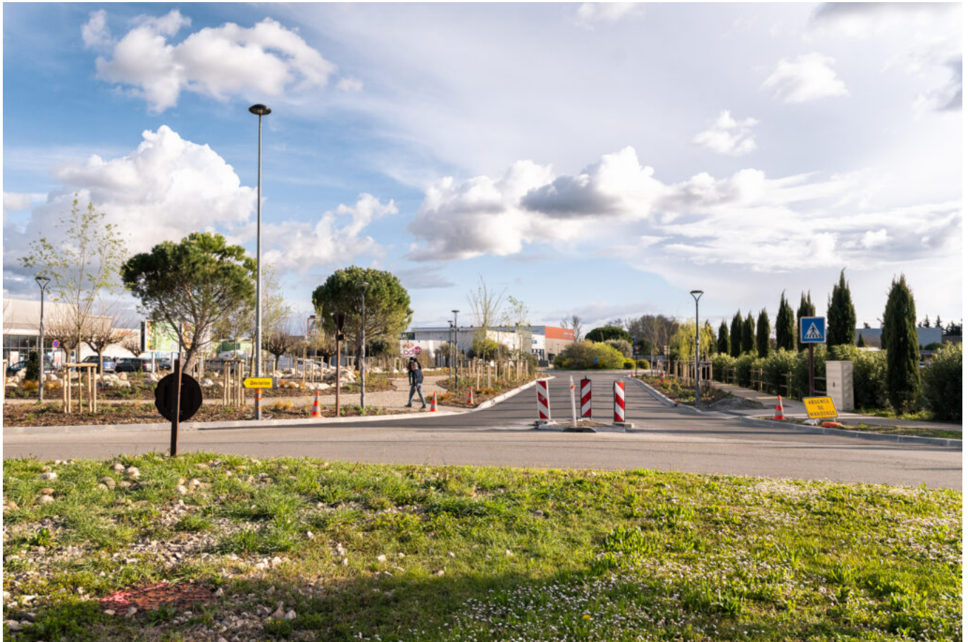
Fin des travaux de la Cristole

Depuis 2021, le montant total des réhabilitations dans les ZAE s'élève à 12,4 M d'€.