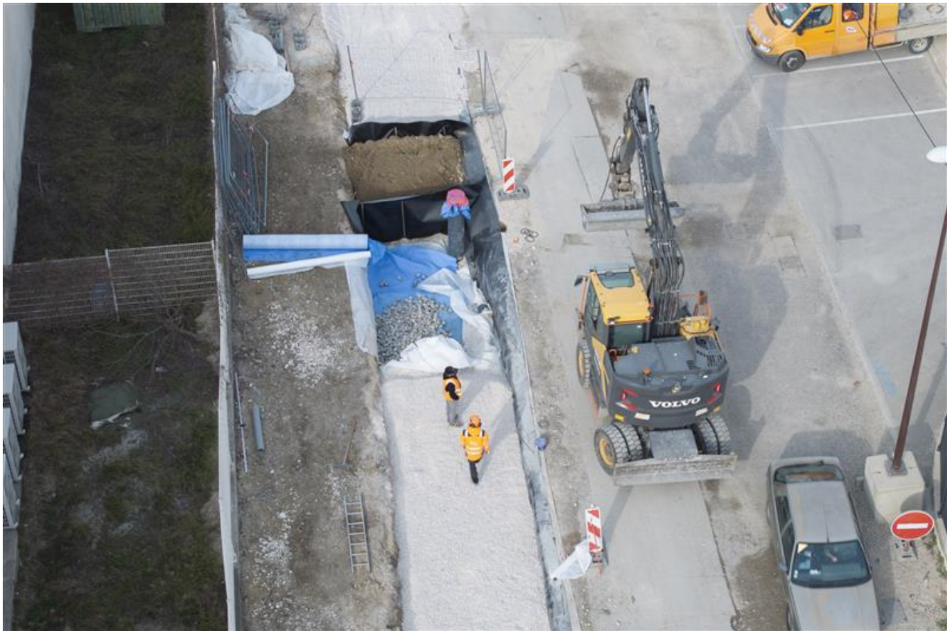
L'Orme Fourchu