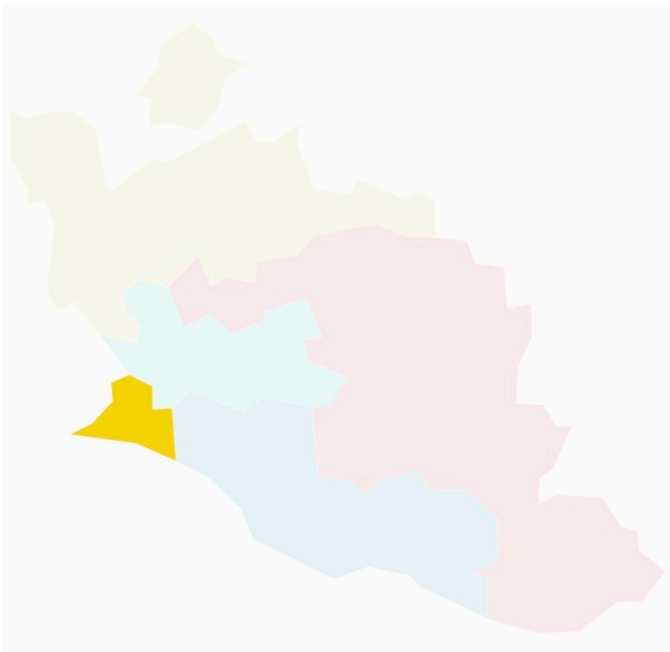
1re circonscription de Vaucluse

Ecrit par Laurent Garcia le 30 juin 2024